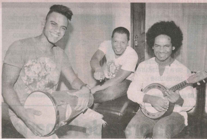
O GRUPO de pagode Pele Morena gravou o primeiro CD em 2007