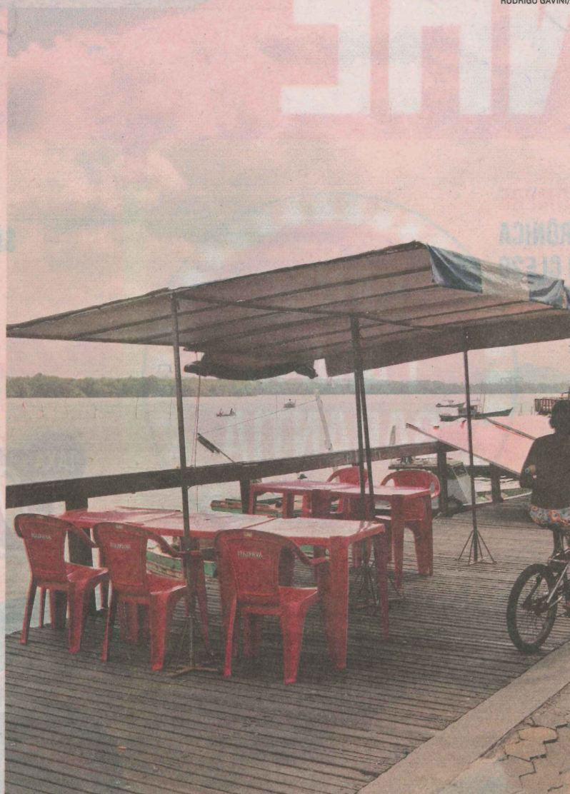
MESAS de restaurante na ilha das Caieiras ocupam passagem de pedestres

Alcy agradece as desculpas da casa e disse esperar que as falhas apontadas sejam corrigidas o mais breve possível