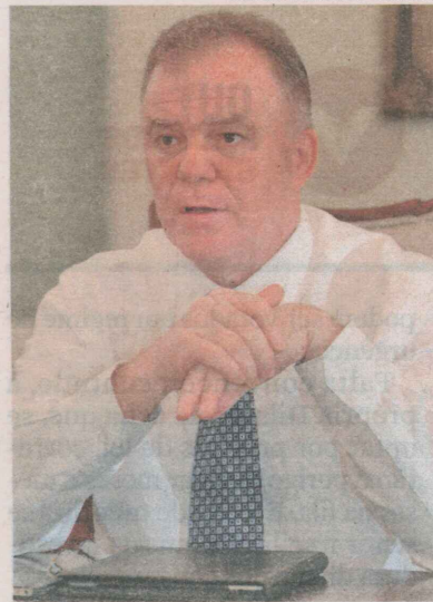
CASAGRANDE: posse do conselho

Inovação é peça fundamental da Lei de Inovação, aprovada em 2012, e irá dar suporte para o salto entre exportadores de commodities para exportador de conhecimento e tecnologia.