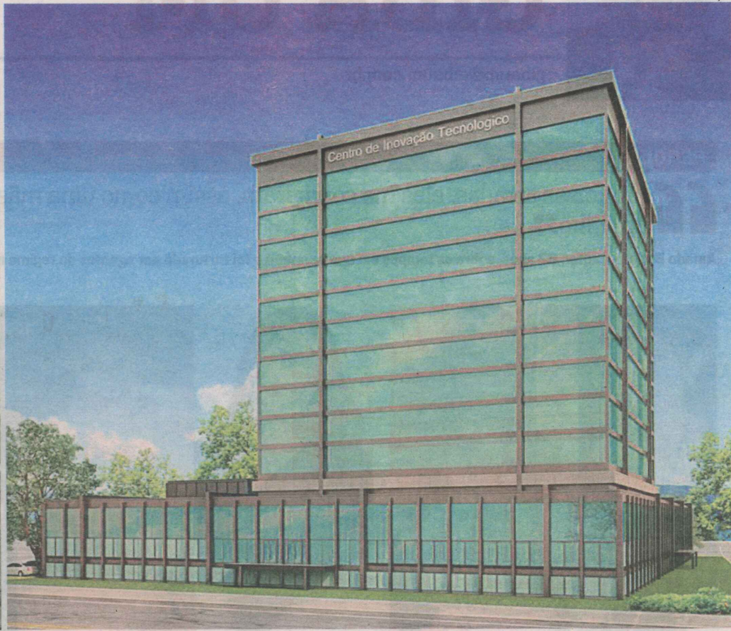
PROJETO DO POLO de Inovação Tecnológico da Serra, que será construído na Rodovia do Contorno: previsão de atração de empresas e criação de empregos para profissionais qualificados