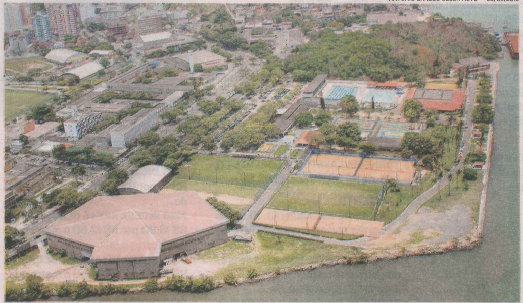
ANTONIO CARLOS CESSA NETO - 29/05/2012

ATUAL SEDE DO CLUBE ÁLVARES CABRAL: expectativa é de que, após a ampliação, número de sócios-proprietários suba de 2 mil para 5 mil