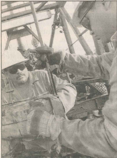
Indústria de petróleo: contratos

Durante dois dias da Rodada de Negócios da Rio Oil & Gas Expo and Conference 2006, 188 empresas de 10 estados brasileiros conseguiram fechar negócios da ordem de R$ 100 milhões com 25 grandes organizações do mercado de petróleo e gás natural do mundo. A estimativa é de que nos próximos seis meses, outros R$ 200 milhões sejam contratados.