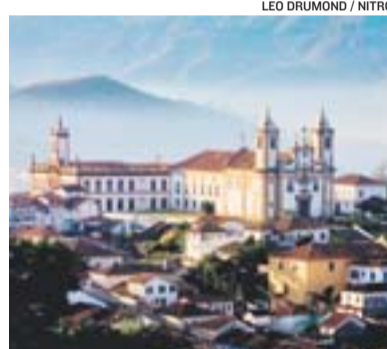
IGREJA em Ouro Preto é atração

Entre os principais atrativos naturais da Rota em Minas, está o Parque Cachoeiras das Andorinhas, em Alto Jequitibá.