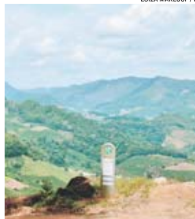
LAVRINHAS, em Venda Nova

Parque Ribeirão dos Pardos, Cachoeira do Rio do Meio, Cachoeira da Holanda e Cachoeira da Fazenda do Tirol