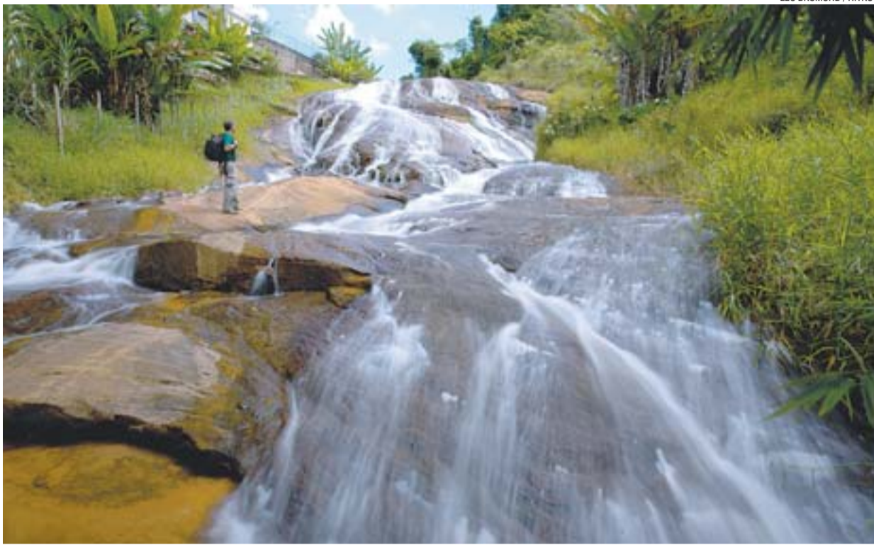
CACHOEIRA localizada em Ibitirama é um dos atrativos da nova rota, que liga o Estado a Minas Gerais

“Além do contexto turístico e histórico, a Rota deve fortalecer as propriedades rurais e o agronegócio”, afirmou.