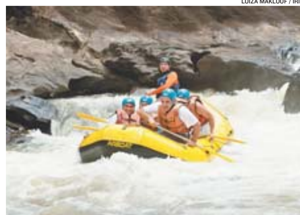
RAFTING Rio da Montanha é um dos atrativos em Domingos Martins

> AGROTURISMO e atrativos naturais: Restaurante Vovó Rosinha, Produtos Poubel, Vinícola Guizzardi, Casa do Café Teeiro, Mata da Onça Lazer, Nascente das Flores, Pousada Morada dos Sonhos, Sítio Novo Horizonte, Sítio Toinzé, Vinícola Guizzardi e Chácara 3G.