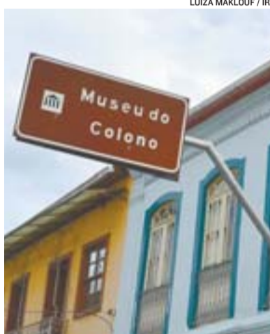
MUSEU em Santa Leopoldina

> AGROTURISMO e atrativos naturais: Trilha Imperial, Gruta do Limoeiro, Gruta da Boa Sorte, Cachoeira da Fumaça, Cachoeira do Vargas, Cachoeira do Marettos, Cachoeira do Racha Bunda, R&R Produtos Caseiros, Produtos Caseiros da Edinéia,