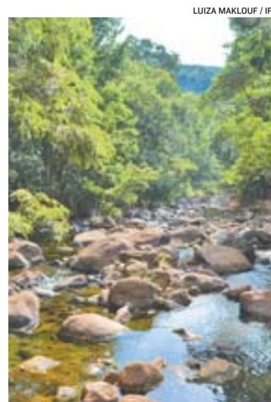
TRECHO da Rota Imperial em Lúna

> AGROTURISMO e atrativos naturais: Pedra da Tia Velha, Pedra da Maminha, Gruta São Quirino, Cachoeira do Chiador, e Fazenda Virginia.