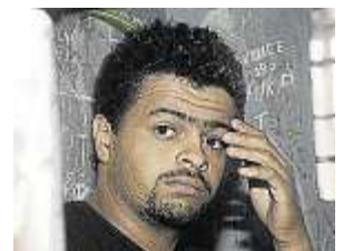
Mineiro é acusado de ser comparsa do traficante