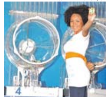
SORTEIO: prêmio milionário