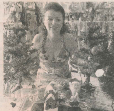
PENHA tem loja de presentes

“Tem muita opção para decorar e deixar o Natal das pessoas daqui muito mais alegre e colorido”, comentou.