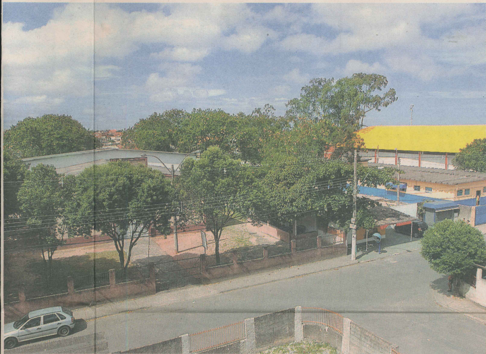
ESTRUTURA. Além das casas, bairro construído pela Cohab conta com 47 blocos de apartamentos.