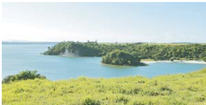
TERRAS às margens da Lagoa Juparanã, onde americanos se instalaram