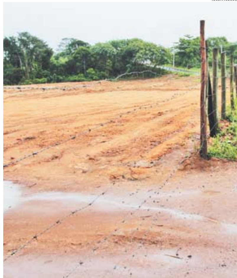
ÁREA onde serão construídas casas do Conjunto Habitacional Ourimar