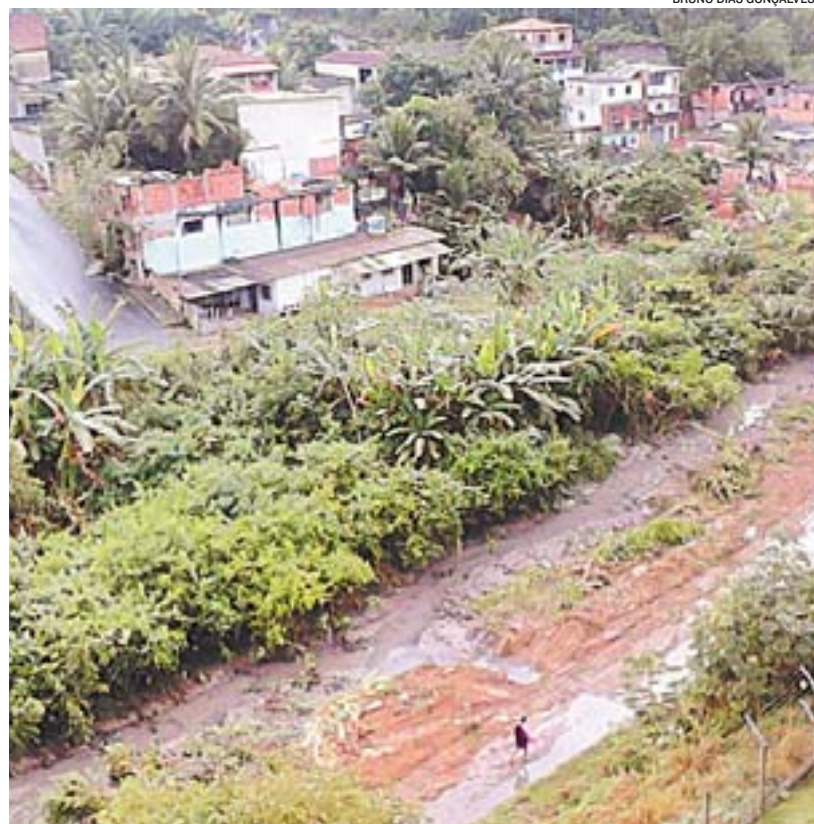
ÁREA que está sendo monitorada, no bairro Hélio Ferraz, na Serra

Quanto às demais atividades ilícitas que estão ocorrendo na região, o Comando do Batalhão informa que já solicitou o reforço do policiamento