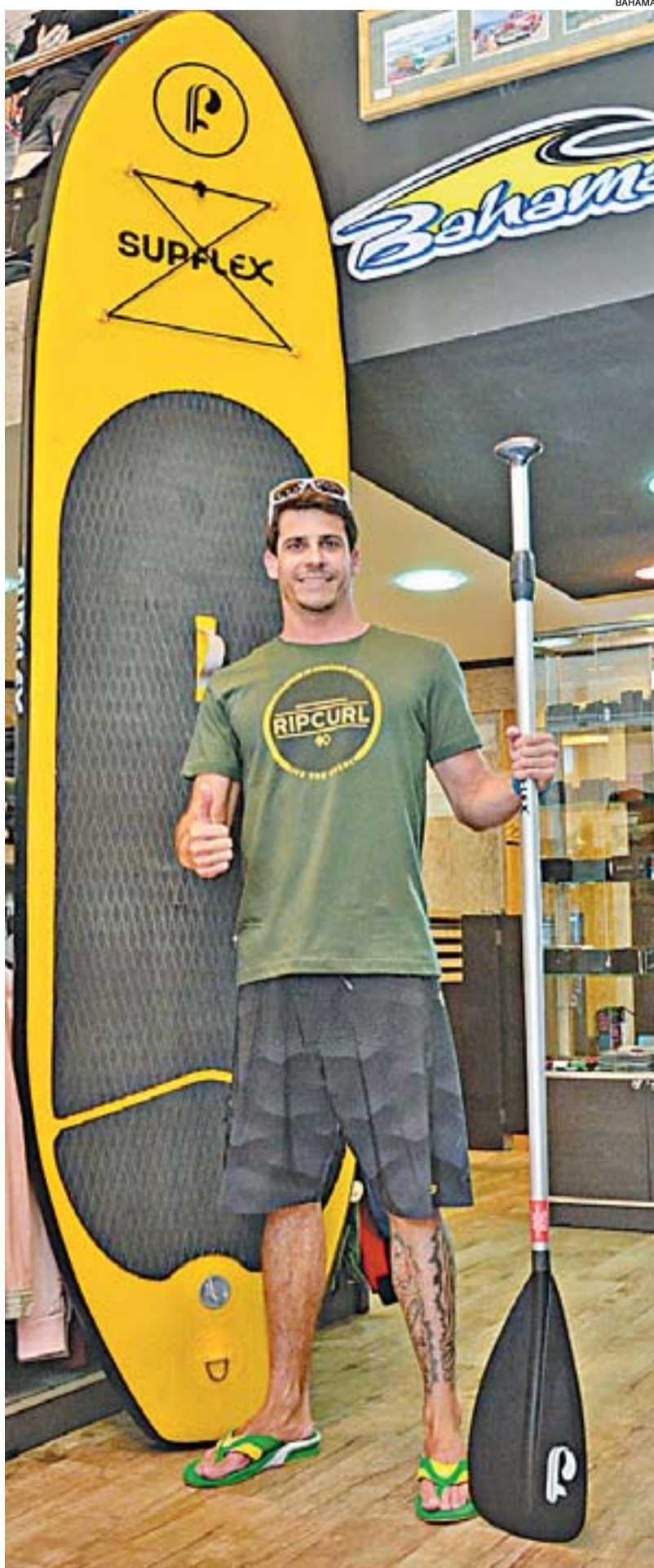
BAHAMAS: moda casual, skate, roupas e equipamentos de surfe