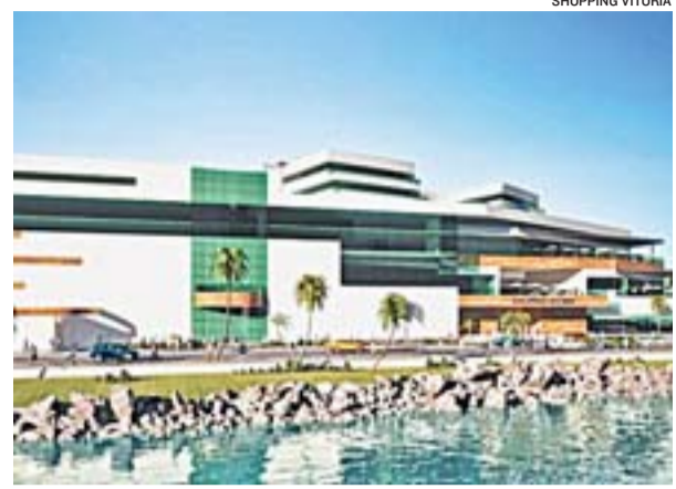
PROJETO da quarta expansão do shopping está sendo analisado pela Prefeitura de Vitória

Minha crença é de que o Espírito Santo continue crescendo e vamos consolidar cada vez mais nosso empreendimento. Atentos a este cenário favorável, investimos continuamente na modernização do Shopping Vitória. Estamos injetando, no momento, R$ 12 milhões para reformar os banheiros, trocar os pisos e toda a iluminação para o shopping ficar renovado no Natal. Fazer a próxima expansão, aumentando o mix oferecido ao consumidor, entre outros serviços, e continuar como o espaço de compras e entretenimento preferido dos capixabas, é nossa meta principal.