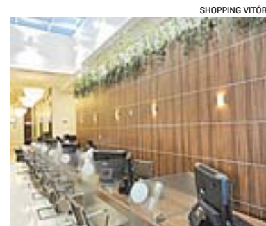
MAIS de 50 profissionais atendem