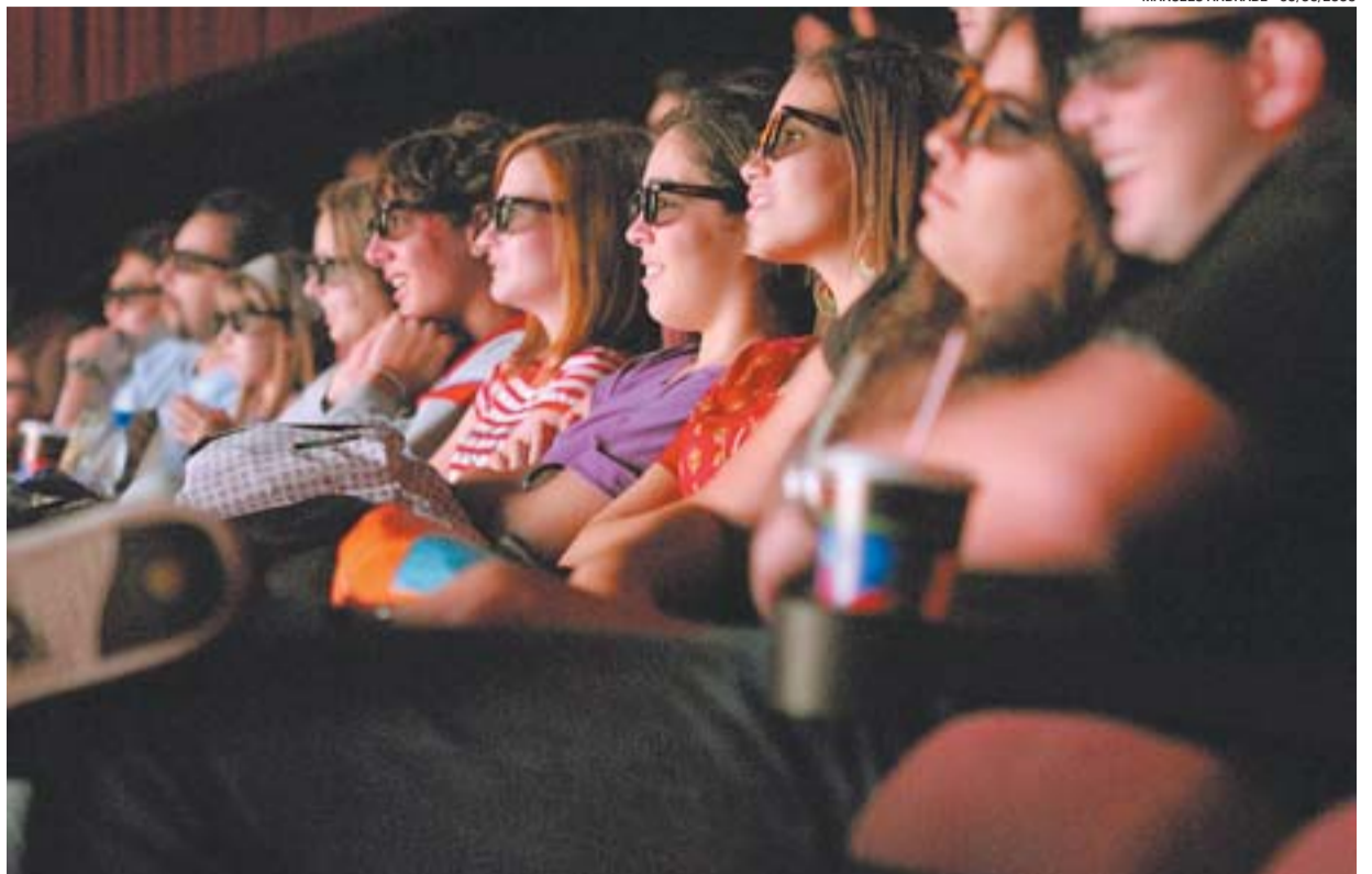
PÚBLICO SE DIVERTINDO NO CINEMA: as oito salas de projeção do shopping comportam 1.933 pessoas

Os adeptos de uma vida mais saudável puderam participar do 8º Treino Super Luxo que contou com alongamento, corrida de 40