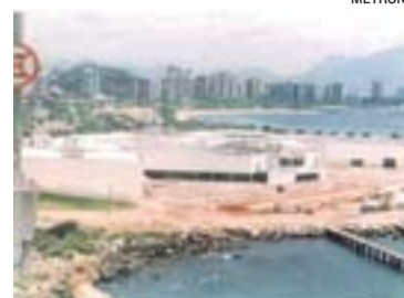
ATERRO: 300 mil metros cúbicos