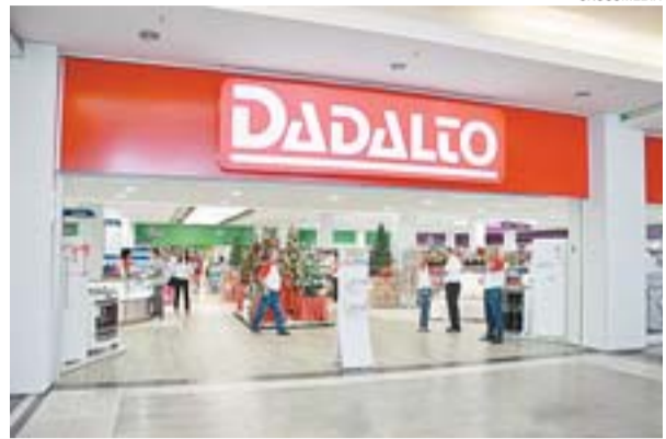
DADALTO: a loja do Shopping Vitória é a maior do grupo, com 2.500 metros quadrados