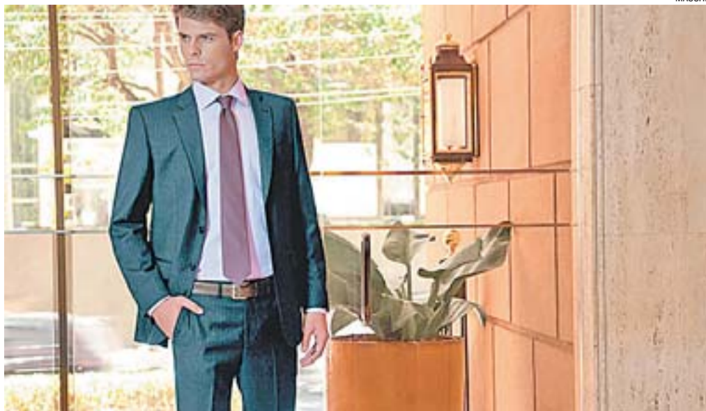
MODELO VESTINDO terno slim, da Maschio, loja capixaba que está no shopping desde a inauguração e trabalha com diversas marcas de roupas masculinas

Os antenados também passam por lojas como Richards, Inicitum e Toulon.