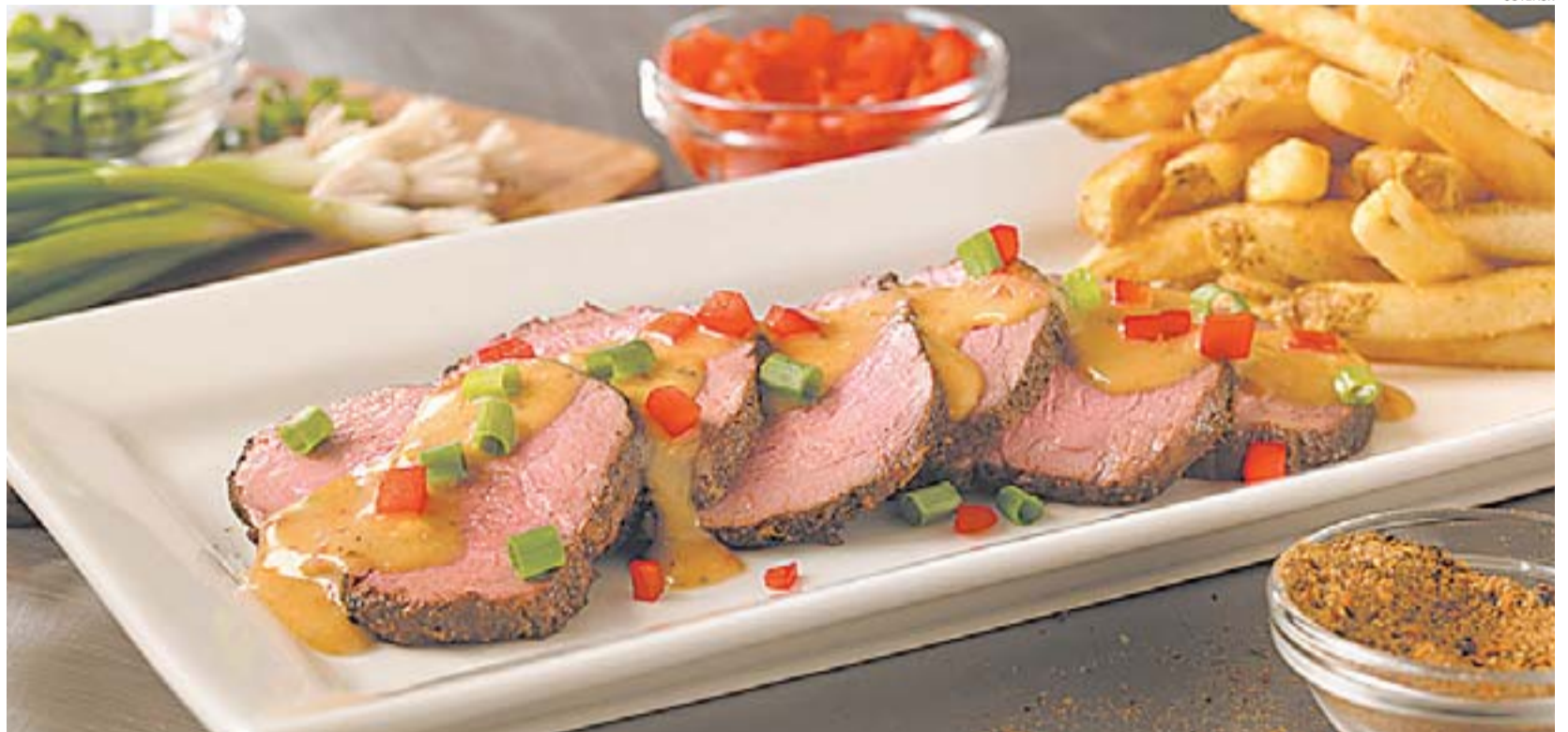
VULCAN STEAK É UM DOS PRATOS da gastronomia australiana que podem ser saboreados no restaurante Outback, no Shopping Vitória