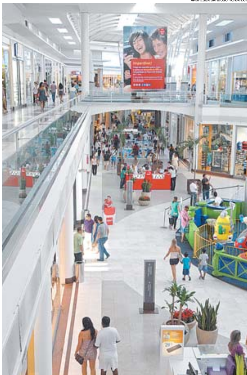
CONSUMIDORES em compras: comodidade inovadora para clientes