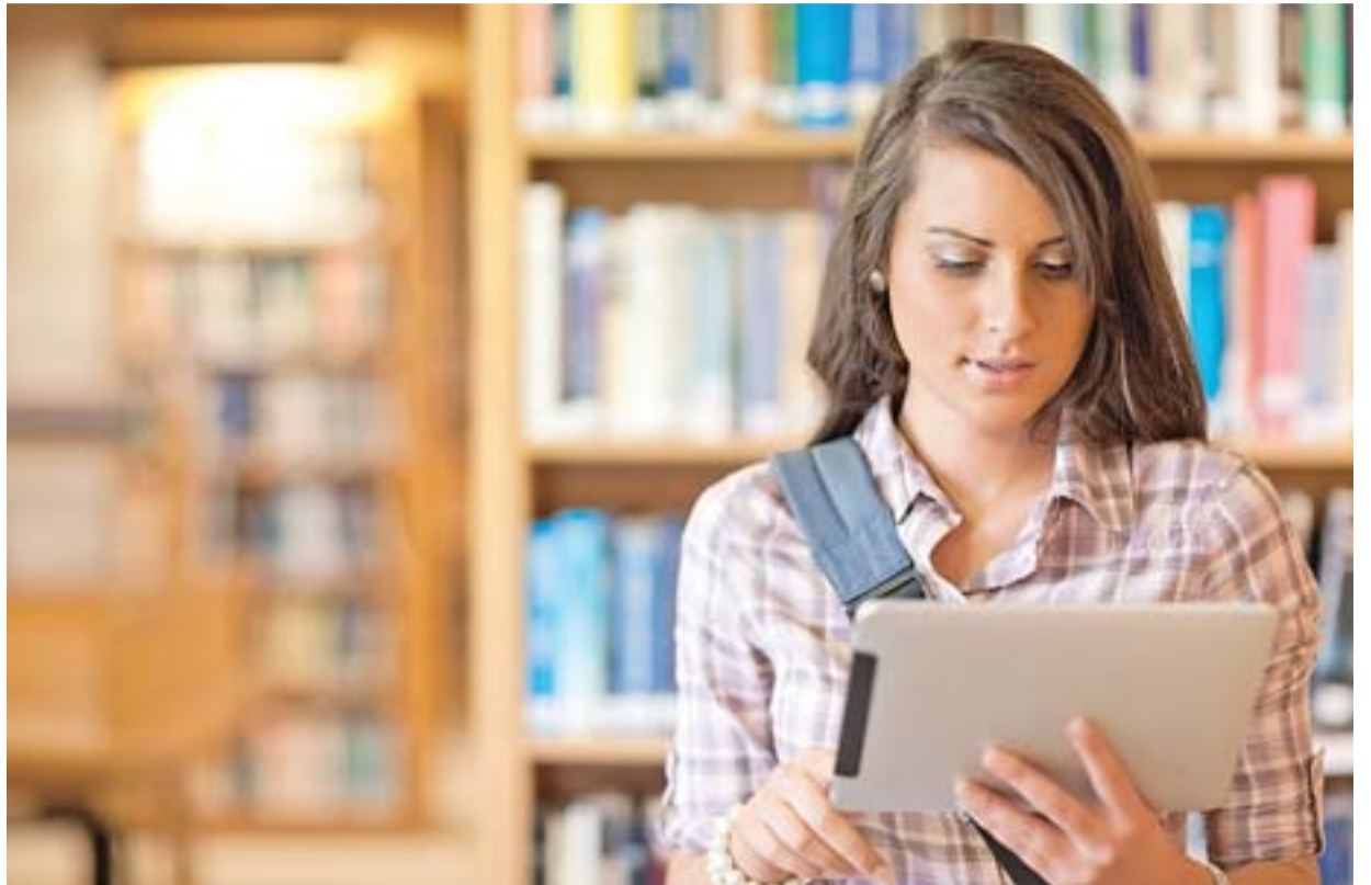
OS CLIENTES podem conferir no site do Shopping Vitória todas as novidades do empreendimento

Turistas estrangeiros que visitam o Estado contam com os serviços das agências de turismo e casas de câmbio. O shopping é uma referência para esse público, que normalmente se hospeda em hotéis situados no entorno da Enseada do Suá, Praia do Canto, Ilha do