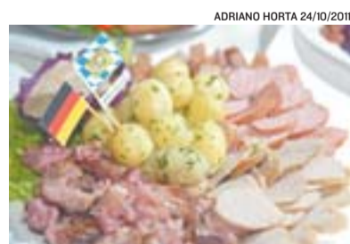
ADRIANO HORTA 24/10/2011