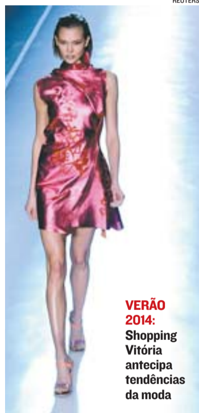
VERÃO 2014: Shopping Vitória antecipa tendências da moda

Para ficarem alinhados, eles podem procurar a Cia do Terno, Ellegance, Brookfield, VR Menswear, Maschio, Mister, entre várias outras lojas. Já para as mulheres, Tons, Tom Maior, Le Lis Blanc, Folic, A.Brand, Animale e Coliseum podem oferecer peças mais formais ou chiques, de acordo com o que o momento pedir.