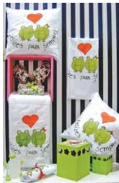
FRICOTE: lembranças temáticas