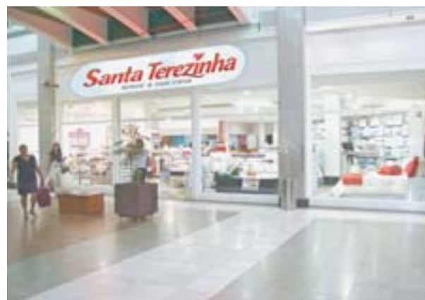
COM UMA LOJA AMPLA no Shopping Vitória, a Casas Santa Terezinha é referência em produtos de cama, mesa e banho