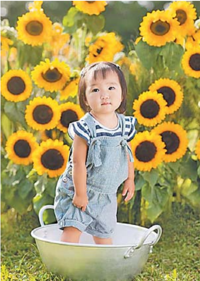
MODA INFANTIL PUC: várias dicas para deixar os pequenos na moda