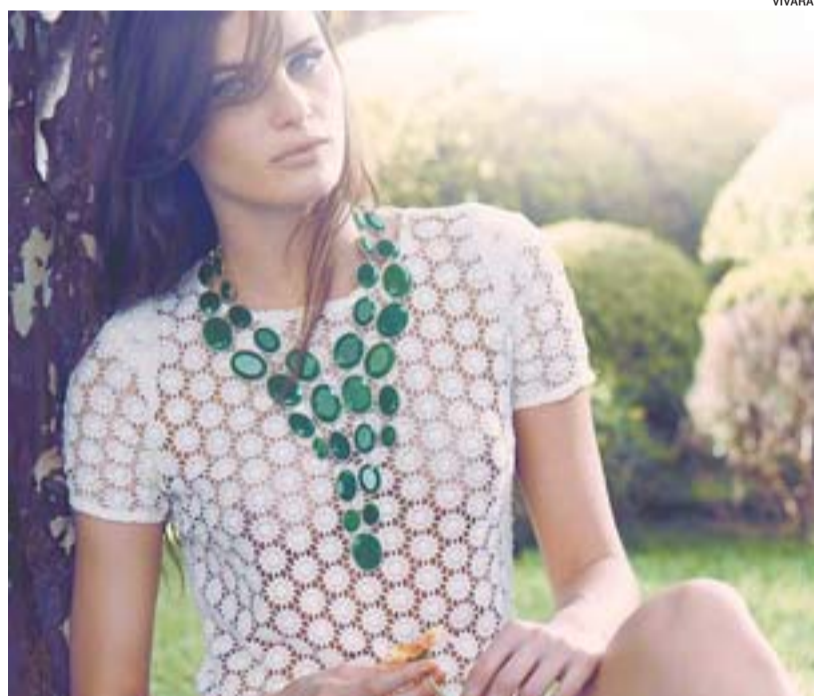
NÃO FALTAM opções para o público que valoriza uma peça sofisticada

Vitória uma oportunidade para investir nesse novo formato de ótica. A unidade da Diniz no Shopping Vitória faz parte de uma rede com mais de 600 lojas espalhadas por 140 cidades, dos 27 estados brasileiros.