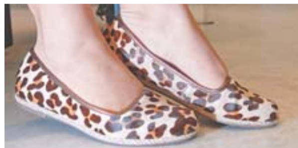
A AREZZO É UMA DAS LOJAS de calçados do Shopping Vitória: opções para todos os gostos