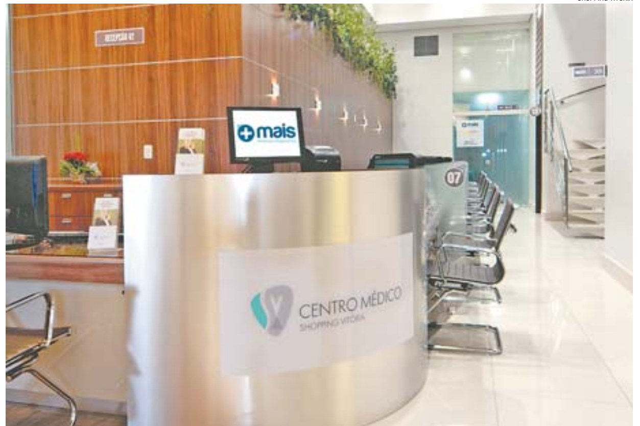
CENTRO MÉDICO disponibiliza serviços de diferentes especialidades e tem horário estendido das 7 às 22 horas

“O Shopping Vitória comemora 20 anos, mas está sempre mantendo o olhar para o futuro. É muito bom estar próximo a uma história de sucesso como essa, que promete ainda muitas novidades para o Espírito Santo nos anos que virão”.