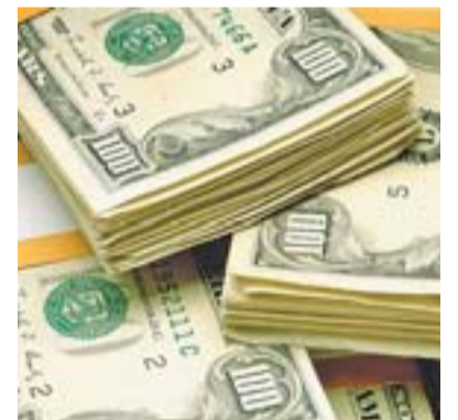
TURISTAS ESTRANGEIROS que visitam o Estado contam com os serviços das agências de turismo e casas de câmbio que funcionam no local