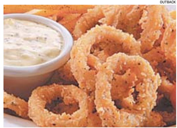
ANÉIS EMPANADOS de lula ao molho marinara, um dos petiscos mais cobiçados dos frequentadores do Outback

“Sempre que venho aqui, quando não como uma boa massa, estou degustando comida árabe. Meus amigos até implicam dizendo que já sabem o que irei comer antes mesmo de pedir”, contou.