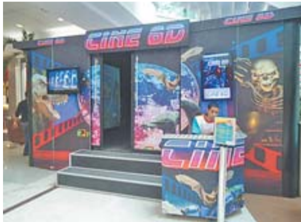
CINEMA 6D, uma das atrações das férias da garotada