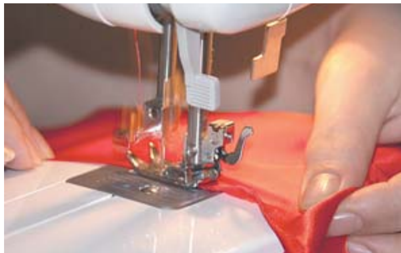
AJUSTES DE ROUPAS , bordados para uniformes, vestidos, saias, além de, outros acertos são serviços oferecidos no Shopping Vitória