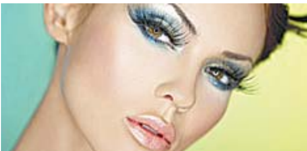
NA HORA DE CUIDAR DA BELEZA , os clientes encontram no Shopping Vitória estabelecimentos que oferecem serviços estéticos como depilação, maquiagem, sobrancelha, cortes de cabelo, hidratação e uma variedade de tratamentos capilares, dentre outras novidades