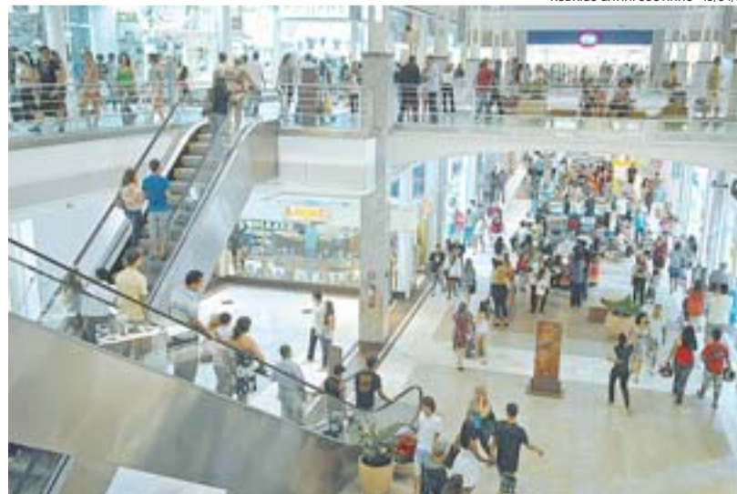
PARA ATENDER os clientes, quase 4.500 pessoas trabalham no shopping