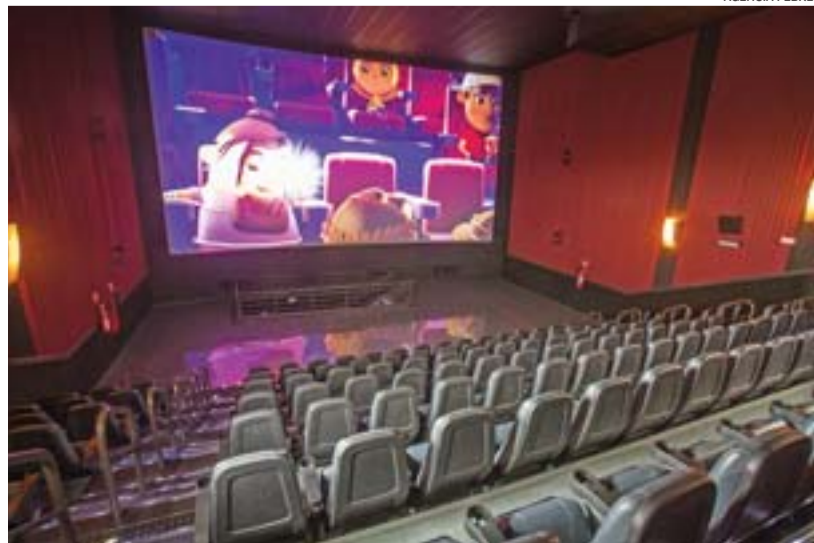
SALAS DE PROJEÇÃO oferecem filmes em terceira dimensão