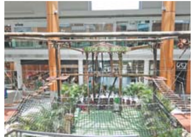
ARVORISMO: espaço reservado para brincadeiras

minutos pela área externa do shopping e ainda recreação para a criançada.