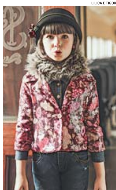
MODELO mirim: roupa da estação

Com utensílios e peças de decoração práticas e que levam diferentes mensagens, também podem ser lugares excelentes para encontrar novidades para os ambientes da casa – e presentes –, as lojas Fricote, Habitat, Imaginarium e Duda Gifts.