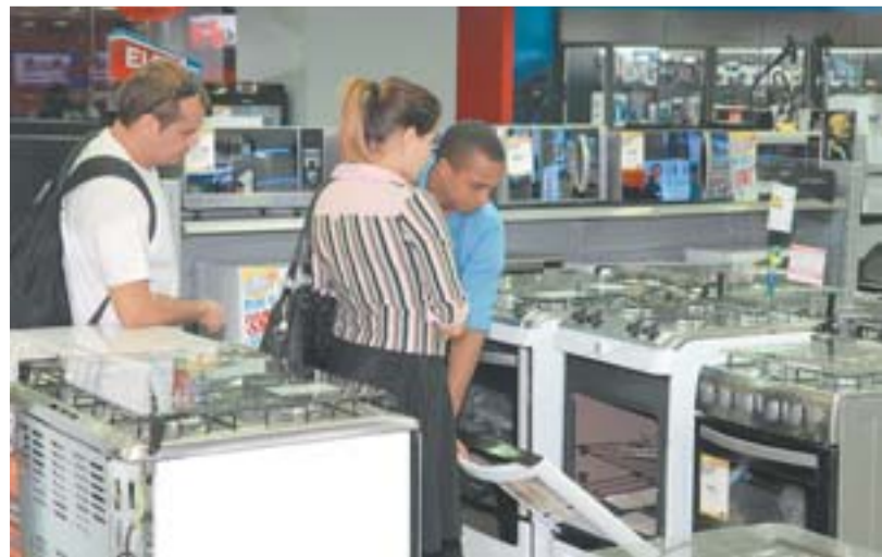
ELETROCITY é destaque no segmento de eletroeletrônicos