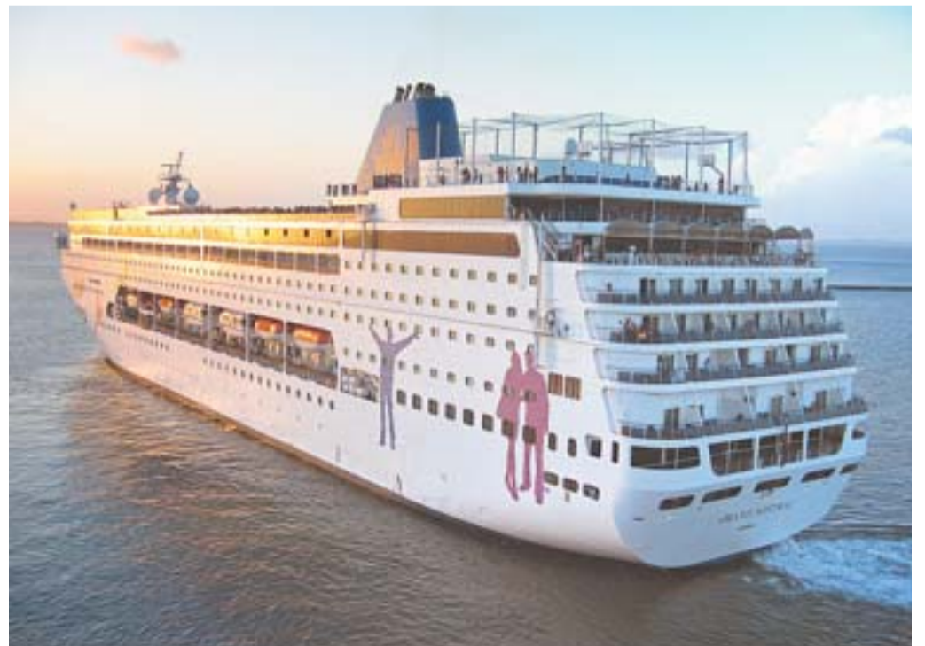
QUEM PRETENDE VIAJAR pode planejar seu roteiro nas agências de viagens disponíveis no shopping, que trazem opções de pacotes para diversos lugares do mundo

ALÉM DE um grande e moderno acervo de livros disponíveis na livraria Saraiva MegaStore, os clientes encontram no local um café, onde podem conferir as novidades do mundo literário. O Shopping Vitória possui, ao todo, três grandes livrarias