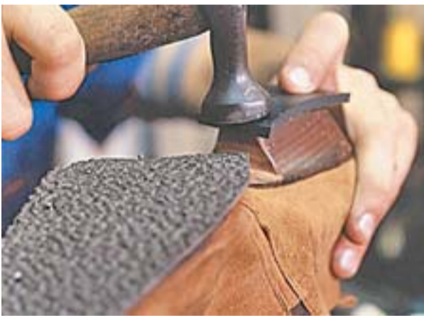
PARA QUEM PRECISA CONSERTAR O CALÇADO , o local conta com serviços de sapataria