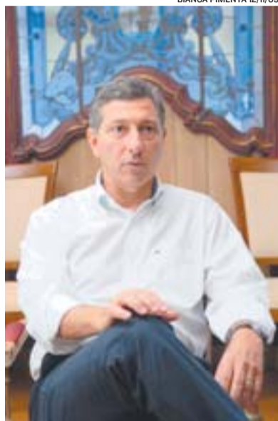
BUAIZ: empregos e oportunidades

“Pesquisas mostram que o Shopping Vitória é um ícone positivo do Espírito Santo”