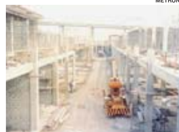
OBRAS no início da década de 90

O prédio se tornou um dos marcos visuais de Vitória e permanece uma obra arrojada.