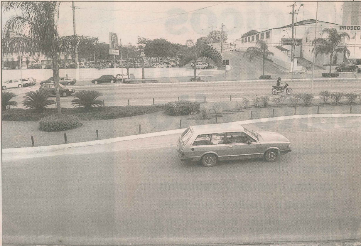
Trecho da BR-101 Norte, onde moradores reclamam das dificuldades em atravessar