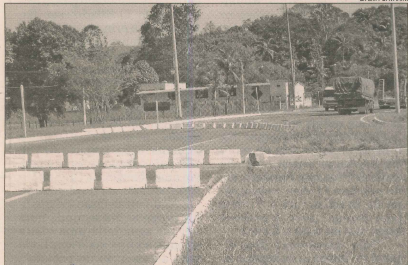
Trevo de Guarapari, na BR-101: redução no risco de acidentes