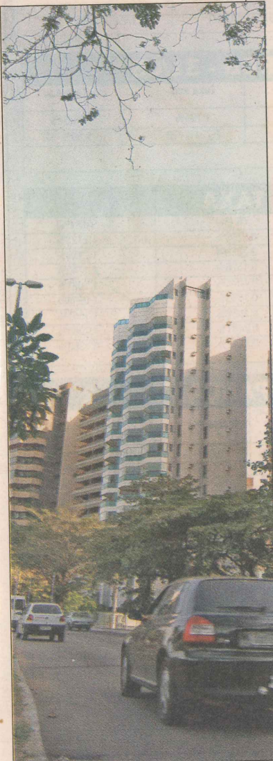
Saturnino de Brito: valorização