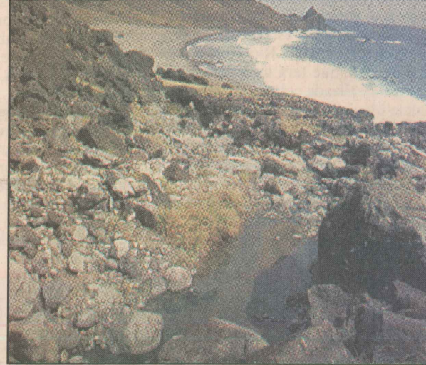
Na praia das Cabras, uma nascente cristalina refresca os visitantes