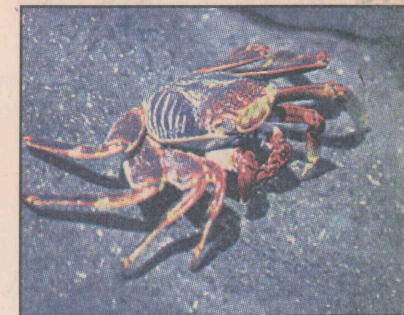
Caranguejo vermelho: habitante natural da ilha