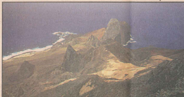
Um vulcão extinto há 200 milhões de anos deu origem às escarpas e picos da ilha