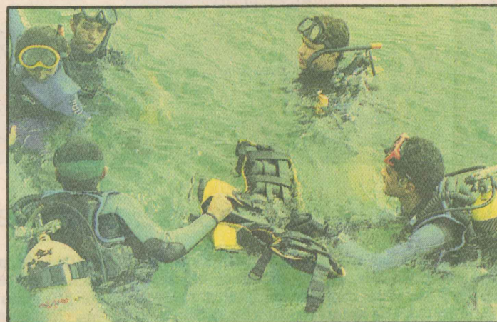
O arquipélago de Três Ilhas, perto de Setiba, em Guarapari, virou point para passeios e para a prática do mergulho. A área oferece um visual privilegiado