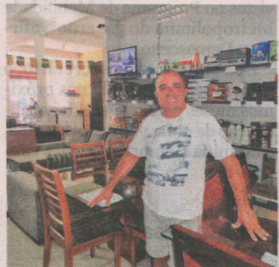
NENO tem duas lojas de móveis

Neno começou a trabalhar no bairro como dono de mercearia e atualmente tem duas lojas de móveis com mais de 150 metros quadrados cada.