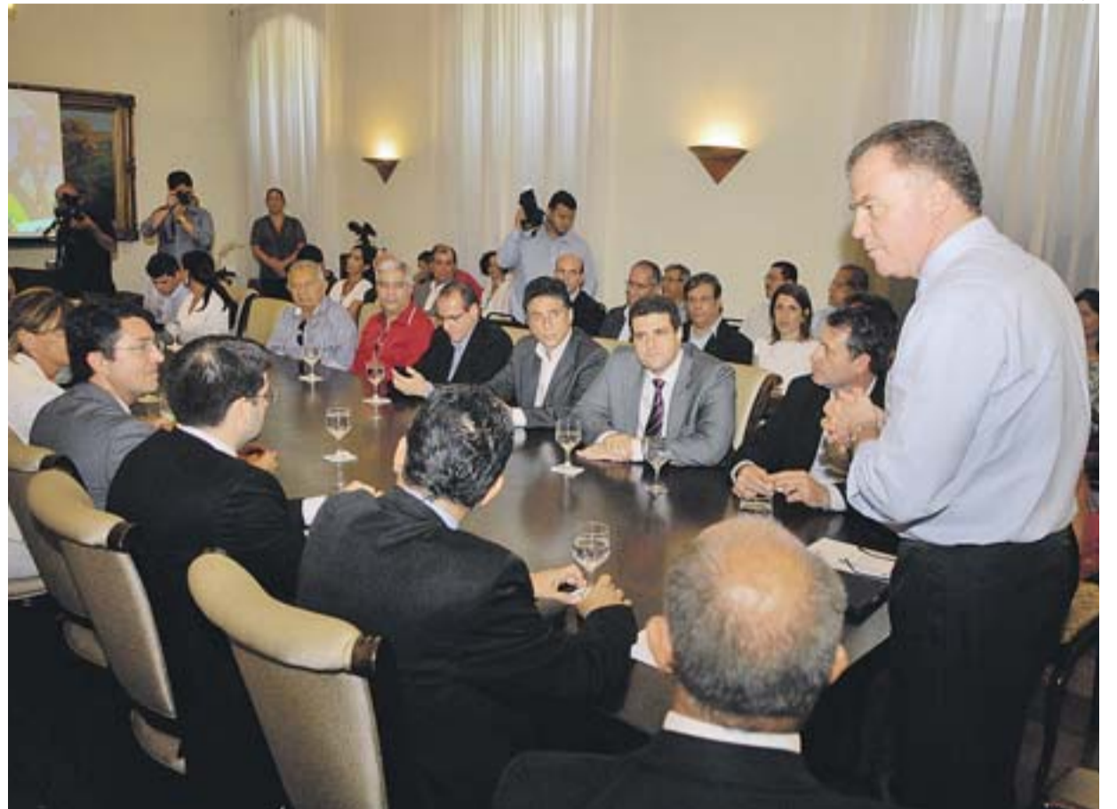
O GOVERNADOR RENATO CASAGRANDE apresentou projeto a prefeitos, secretários e equipe do governo

“Apesar da cobrança, o sistema será subsidiado pelo governo do Estado, que vai investir R$ 6 milhões por ano para manutenção. Por isso, é necessária a aprovação da Assembleia para que possamos fazer esse repasse para a Ceturb, que vai administrar o sistema”, explicou o secretário.