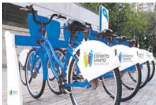
BICICLETAS que serão alugadas à população