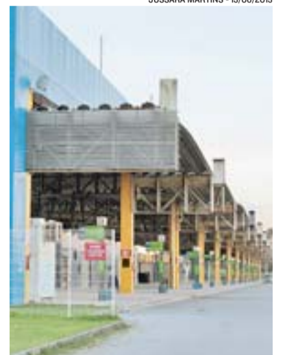
JUSSARA MARTINS - 13/06/2013