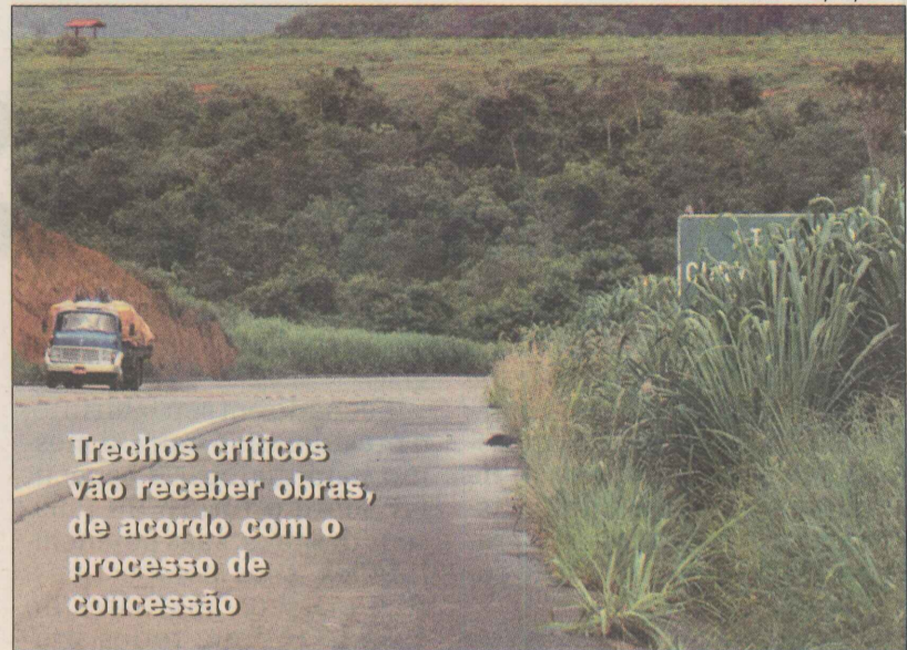
Trechos críticos vão receber obras, de acordo com o processo de concessão

O diretor do departamento ressaltou que o pagamento da tarifa, que está estimada em R$ 6, para carro passeio, começará a ser cobrada após o término das obras, previsto para fevereiro de 2006.