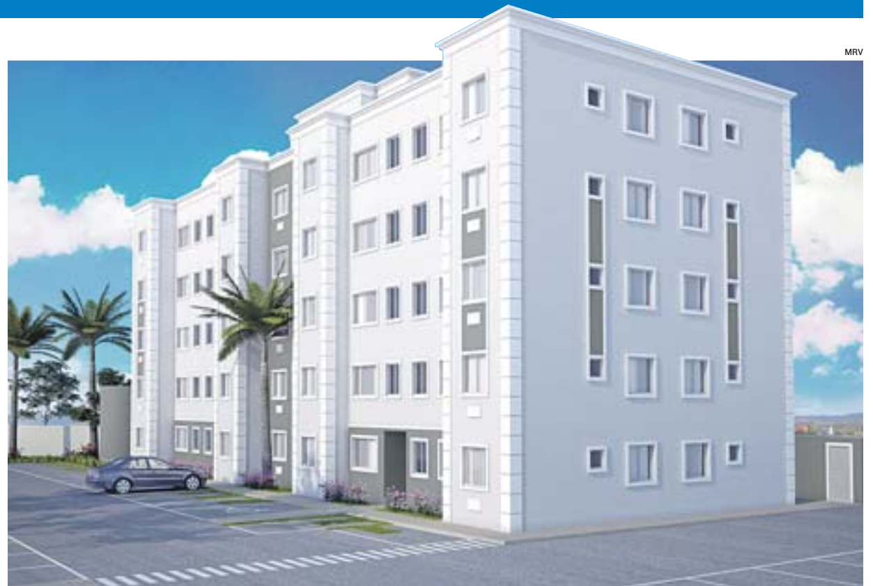
PROJEÇÃO DO PARQUE VIVA JUARA: o empreendimento, em construção, será na Serra, com 330 apartamentos

O empreendimento da MRV Engenharia e Participações S.A. tem lazer com playground, espaços fitness e gourmet, gazebo e quadra, entre outros.