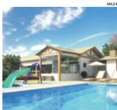
ÁREA do Ecolife Morada das Cássias