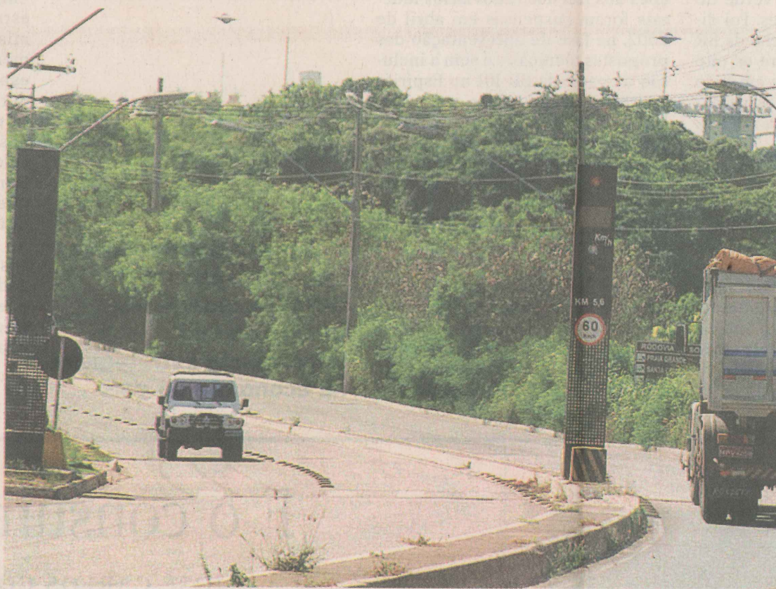
CONTROLE. Novos redutores de velocidade serão instalados na Rodovia do Sol.

Também estão previstas operações especiais de fiscalização do transporte rodoviário intermunicipal pelo Departamento de Edificações, Rodovias e Transportes (DERTES).