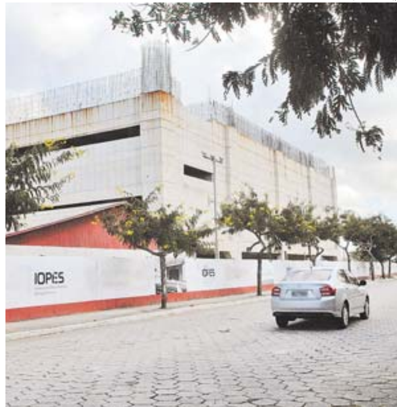
OBRA do Cais das Artes, ao lado da Praça do Papa, na Enseada do Suá

Com um museu climatizado e contendo uma área expositiva de 3.000 metros quadrados, mais um teatro com capacidade para 1.350 espectadores, preparado para abrigar usos