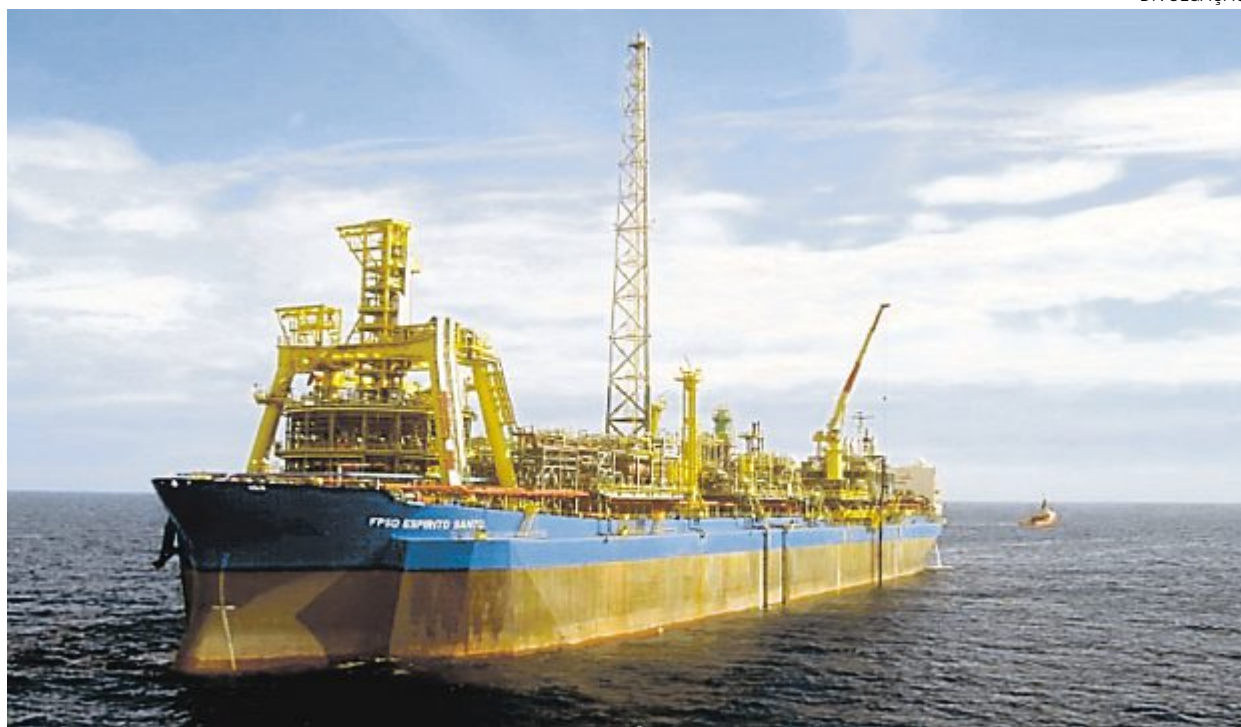
A plataforma-navio FPSO Espírito Santo será usada pela operadora para a produção nos novos campos

Quando chegar à etapa de produção, a Fase 3 do Parque das Conchas poderá atingir um pico estimado de produção de 28 mil barris de óleo equivalente (boe) por dia. Neste parque, a