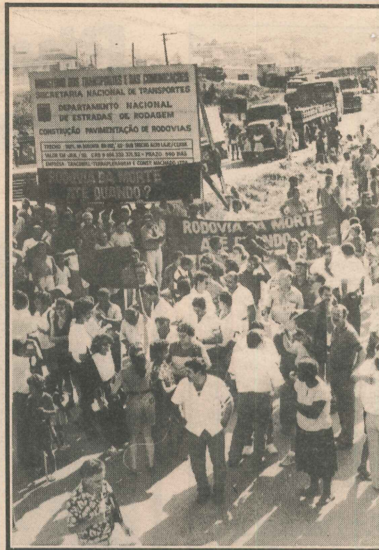
A manifestação durou mais de três horas

O engenheiro disse, no entanto, que já existe verba disponível para dar continuidade às obras de duplicação da pista a partir do contorno de Vitória até Viana, mas ainda não foi realizada a licitação para dar andamento aos serviços.