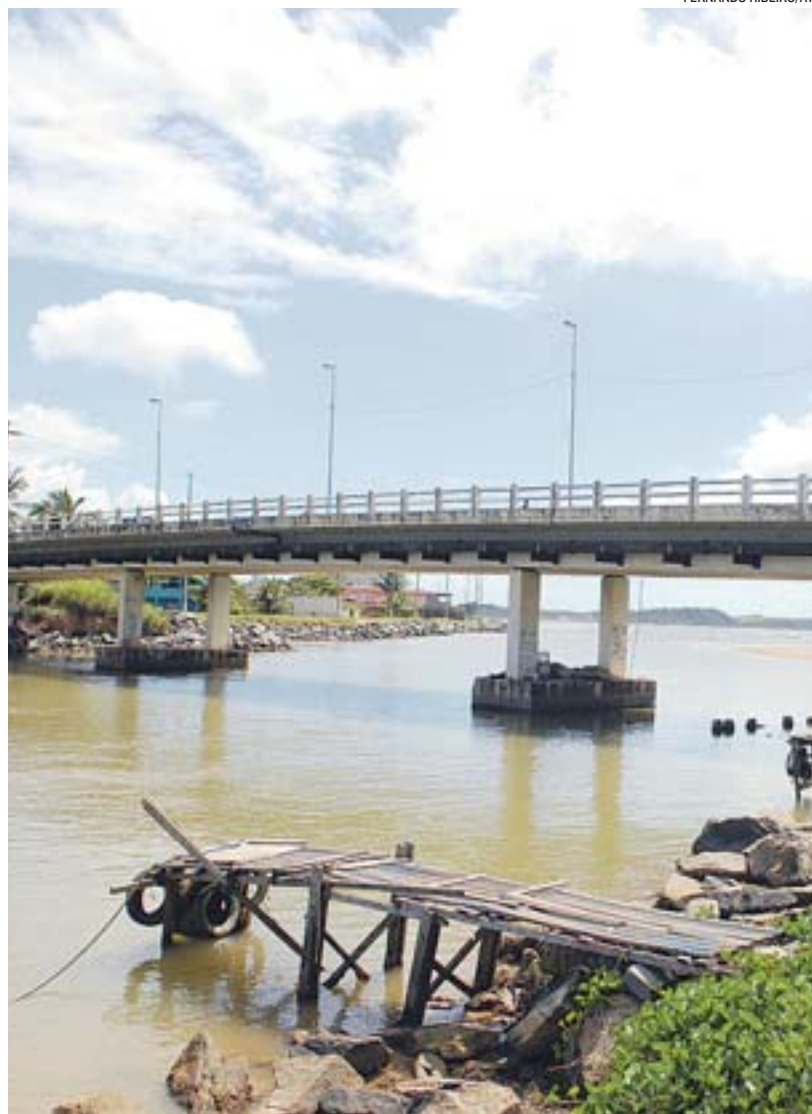
PONTE da ES -010, onde circulam carretas de até 70 toneladas

Gilberto disse esperar que a fiscalização seja intensificada antes que a estrutura da ponte fique prejudicada