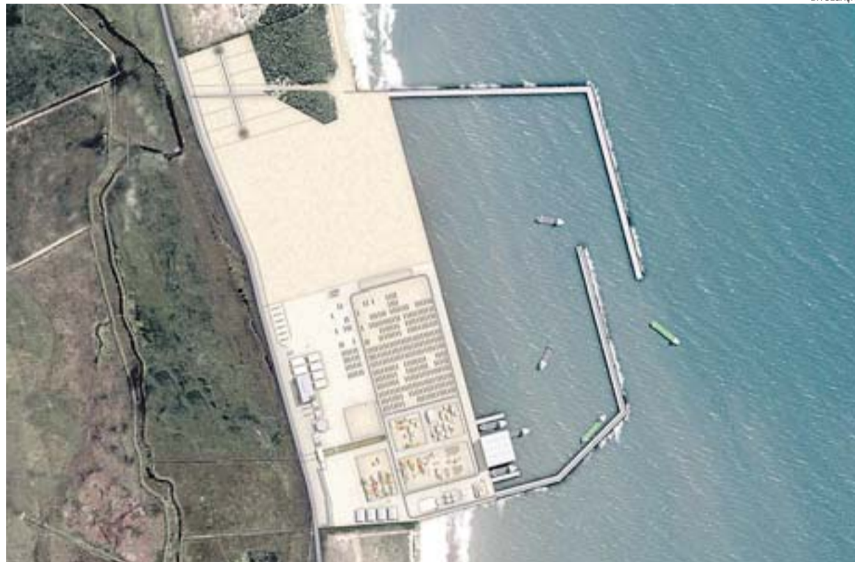
PERSPECTIVA DO PORTO DA PETROCITY, que ficará em uma área de 1,5 milhão de metros quadrados