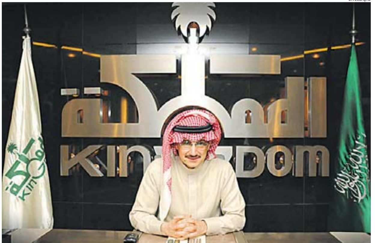
O PRÍNCIPE Khaled Bin Alwaleed Al Saud tem mais de 30 anos de experiência em investimentos de alto nível

Ele é fundador da entidade filantrópica Alwaleed Bin Talal.