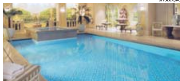
HOTEL GEORGE V, em Paris, é um dos investimentos da Kingdom Holding Company

duas categorias – os investimentos internacionais e os árabes sauditas/regionais.