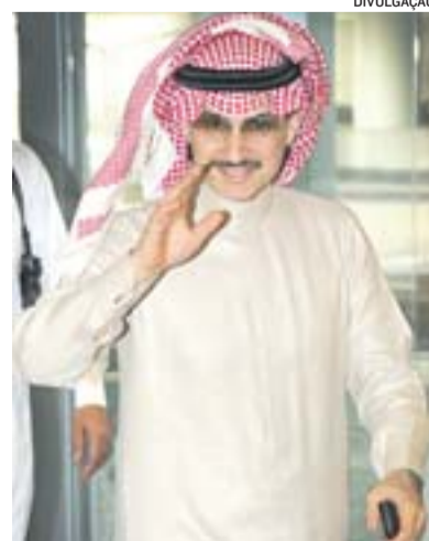
KHALED Bin Alwaleed Al Saud

passageiros, hotel, porto-escola, heliporto e indústria metalmeccânica.