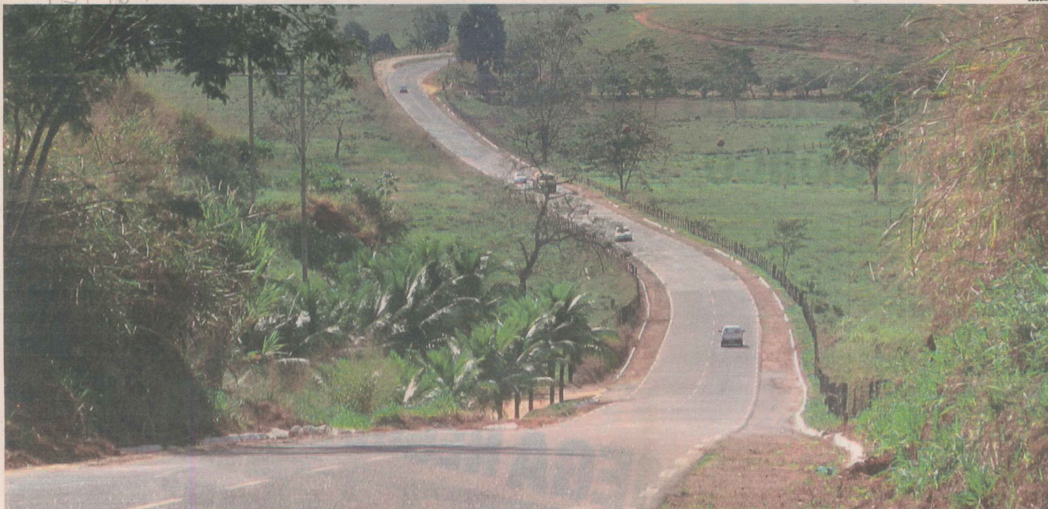
TRECHO da rodovia ES-482, onde haverá duplicação entre Cachoeiro de Itapemirim e Coutinho e recuperação de outros 48 quilômetros: obras estão previstas para o próximo ano