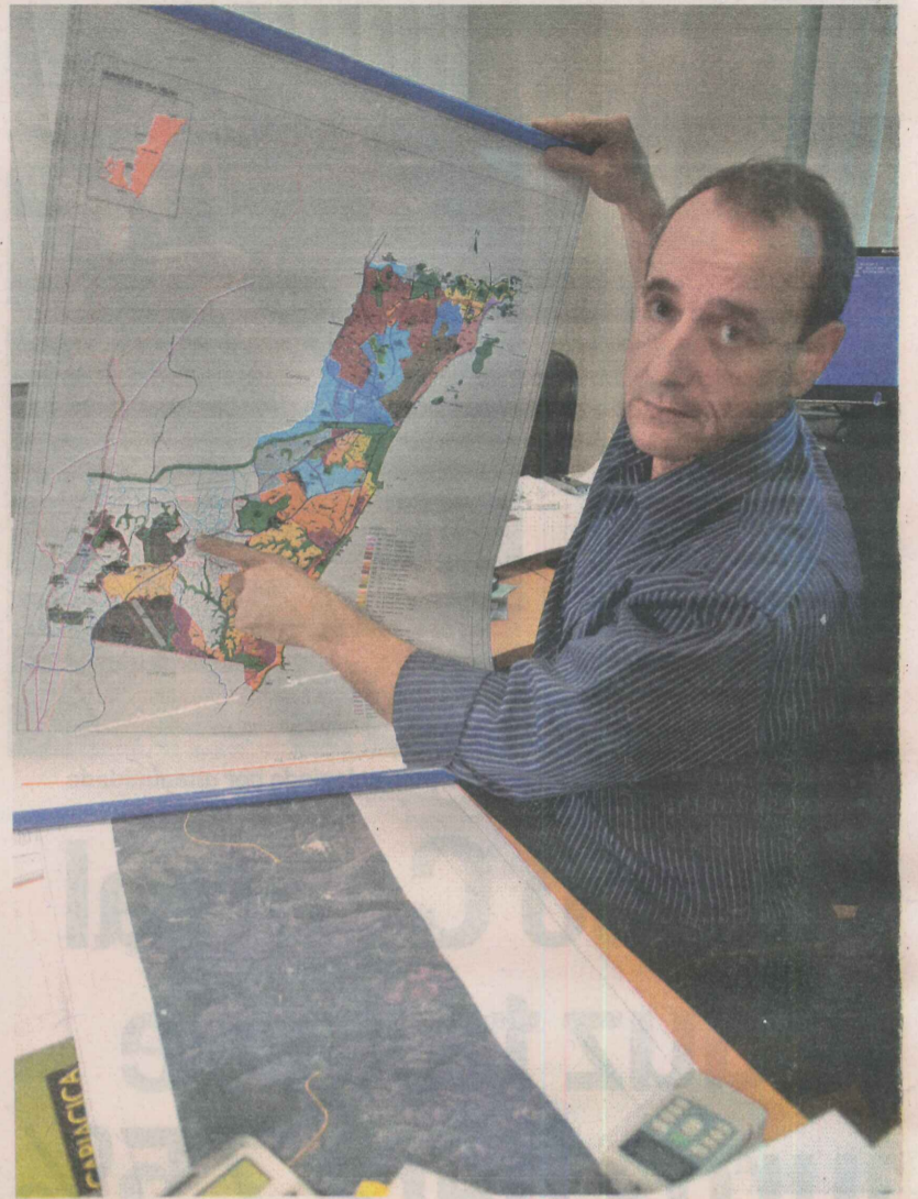
CASAMATA mostrou onde será rodovia: transformação ao longo da ES-388

A expectativa é de que, com os novos polos, empresas de diversos segmentos — como industrial, de serviços, transporte e cargas — se instalem na região e criem 15.198 empregos. Pelo menos 30 empresas já estão em conversa com a prefeitura para se instalar nos polos a serem criados. “Mas por enquanto não podemos adiantar os nomes”, disse Casamata.