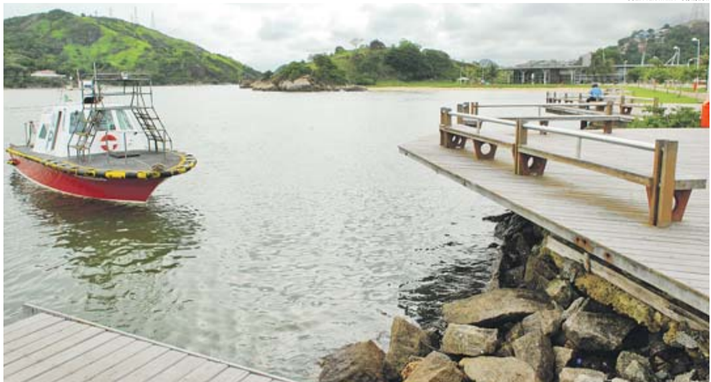
JULIA TERAYAMA - 05/12/2011

Damasceno disse que ainda não há um mês para que o Aquaviário