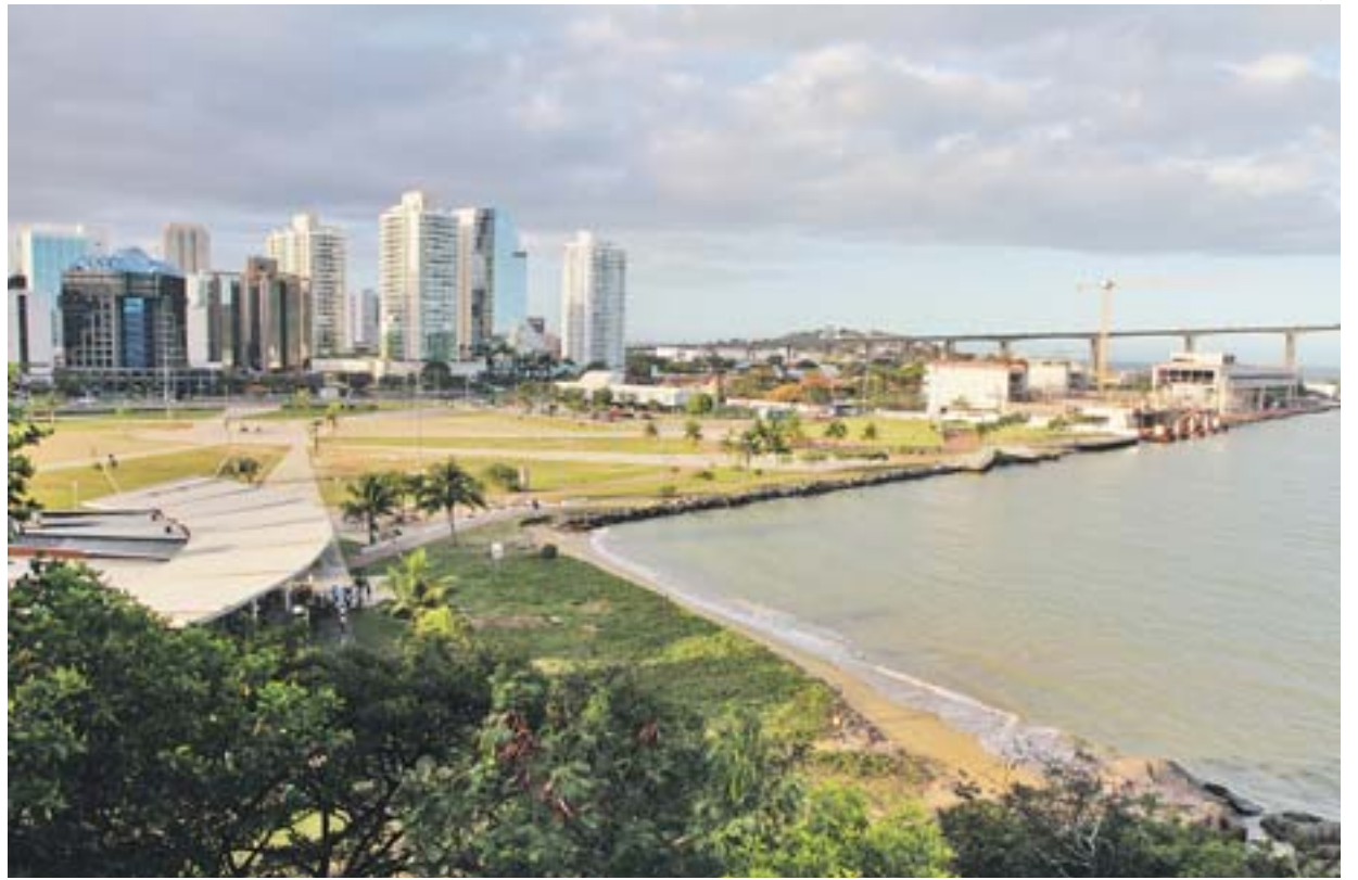
REGIÃO DA PRAÇA DO PAPA, em Vitória, será um dos quatro pontos de parada do projeto do novo Aquaviário