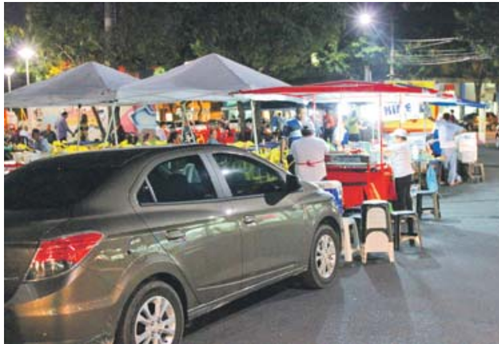
FEIRA EM JARDIM DA PENHA: morador reclama que trânsito fica tumultuado na região

“Já li notícias mostrando que carros estacionados em locais proibidos são multados e aqui eles param aonde querem, em portas de garagem, em cima de faixa de pedestre, na esquina e nada acontece”.