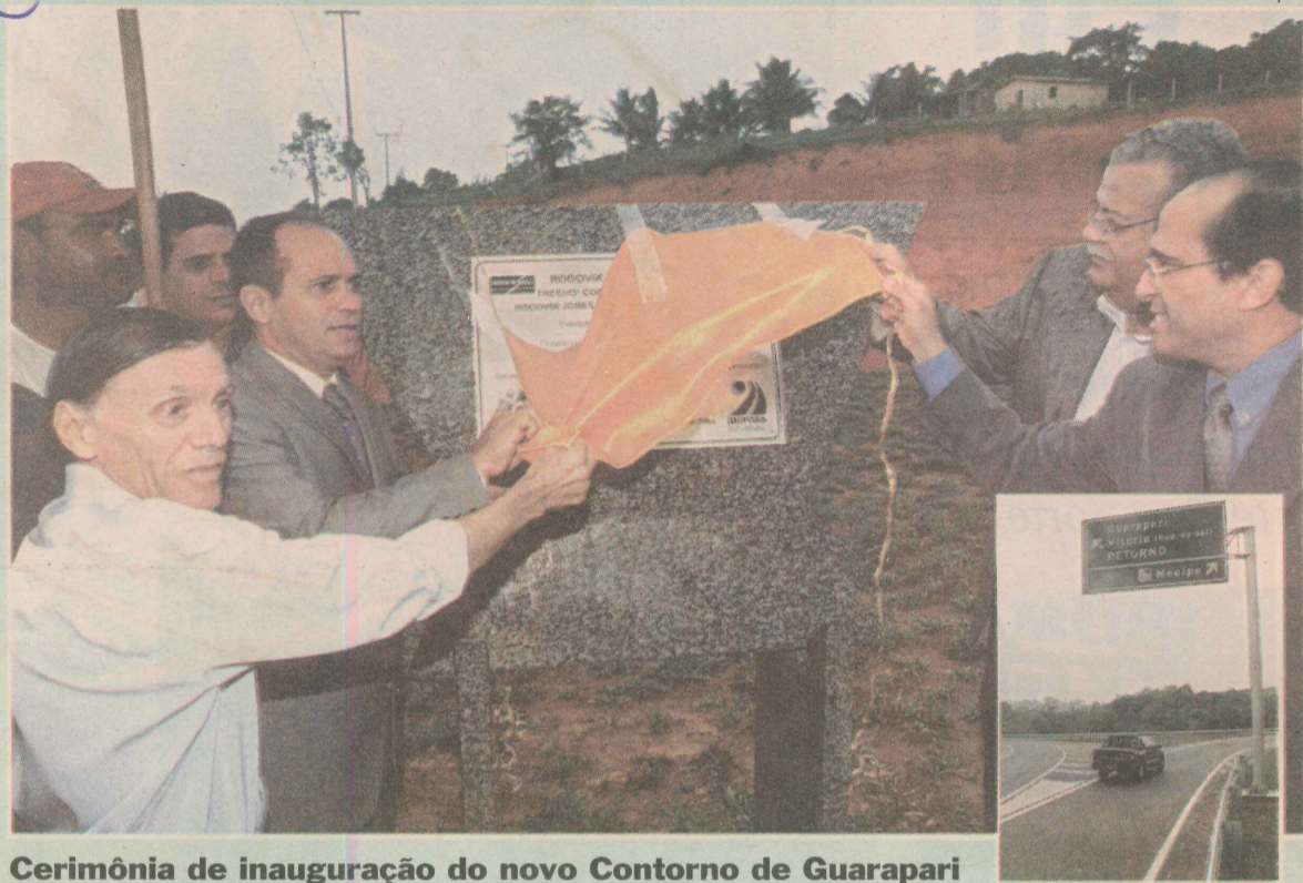
Cerimônia de inauguração do novo Contorno de Guarapari