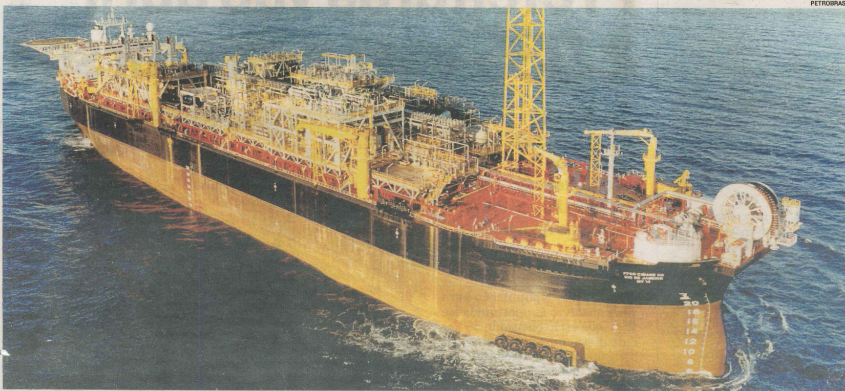
PLATAFORMA DE PETRÓLEO: o setor é um dos que tem maior representatividade entre os megaprojetos destinados ao Espírito Santo