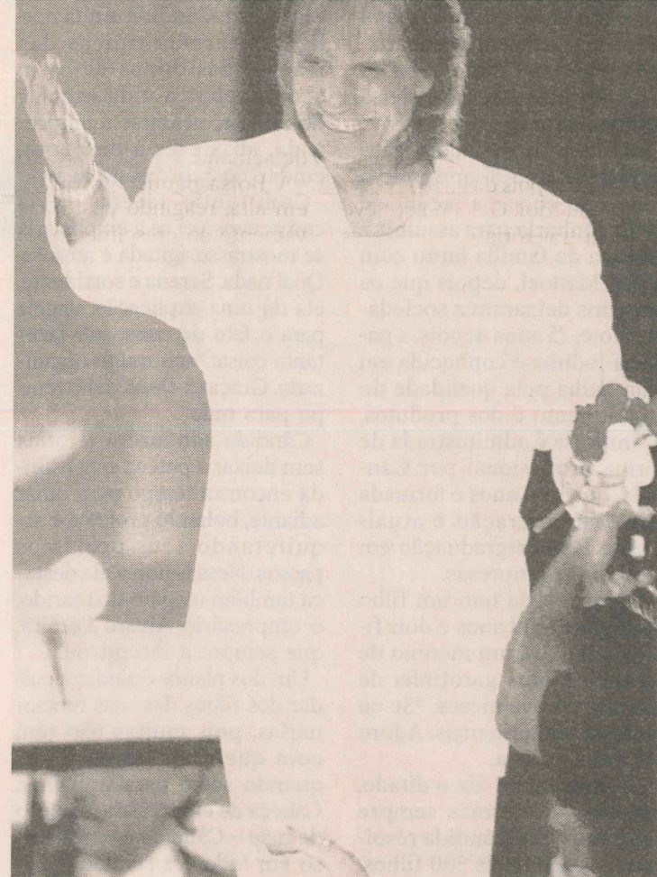
TURNÊ. O show do “Rei”, patrocinado pela Nestlé, deverá acontecer entre os dias 10 e 15 de junho.

■ Hershey's. Há informações de que a norte-americana Hershey's também está interessada na Garoto, mas seus executivos no país não manifestaram a intenção publicamente.