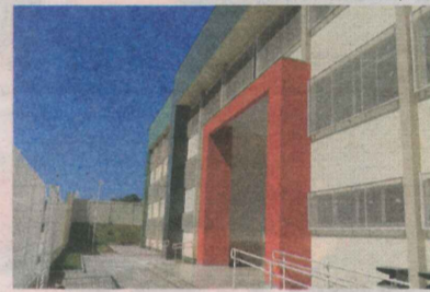
ESCOLA NA SERRA: investimentos