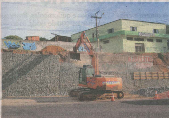
MURO DE ARRIMO em Vera Cruz, Cariacica: obra de 600 metros de extensão