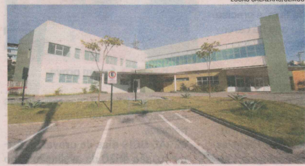
PRONTO-SOCORRO: obras na área da saúde estão entre as prioridades das prefeituras