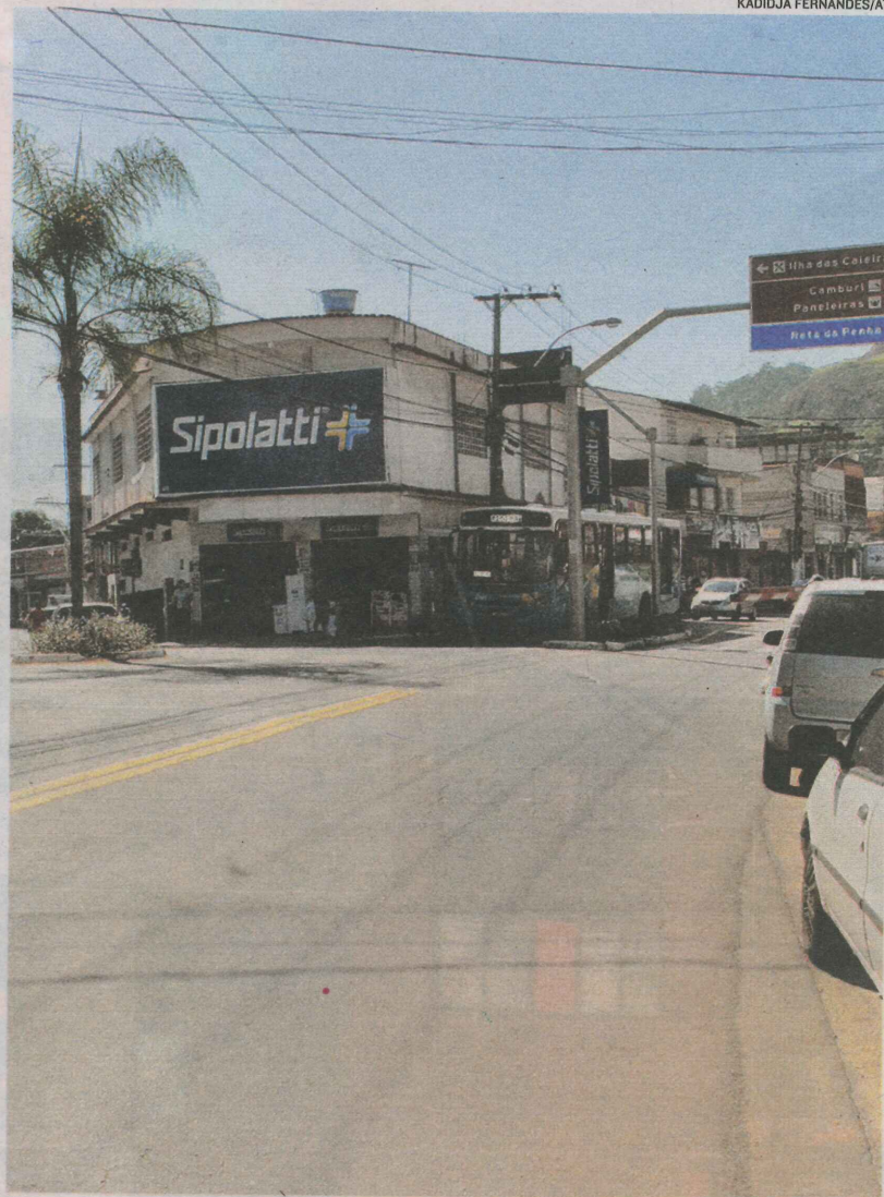
TRECHO da avenida Serafim Derenzi onde muitos pedestres atravessam