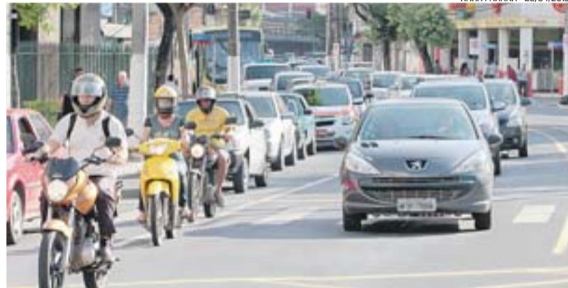
AVENIDA Princesa Isabel tem projeto de corredores exclusivos para ônibus