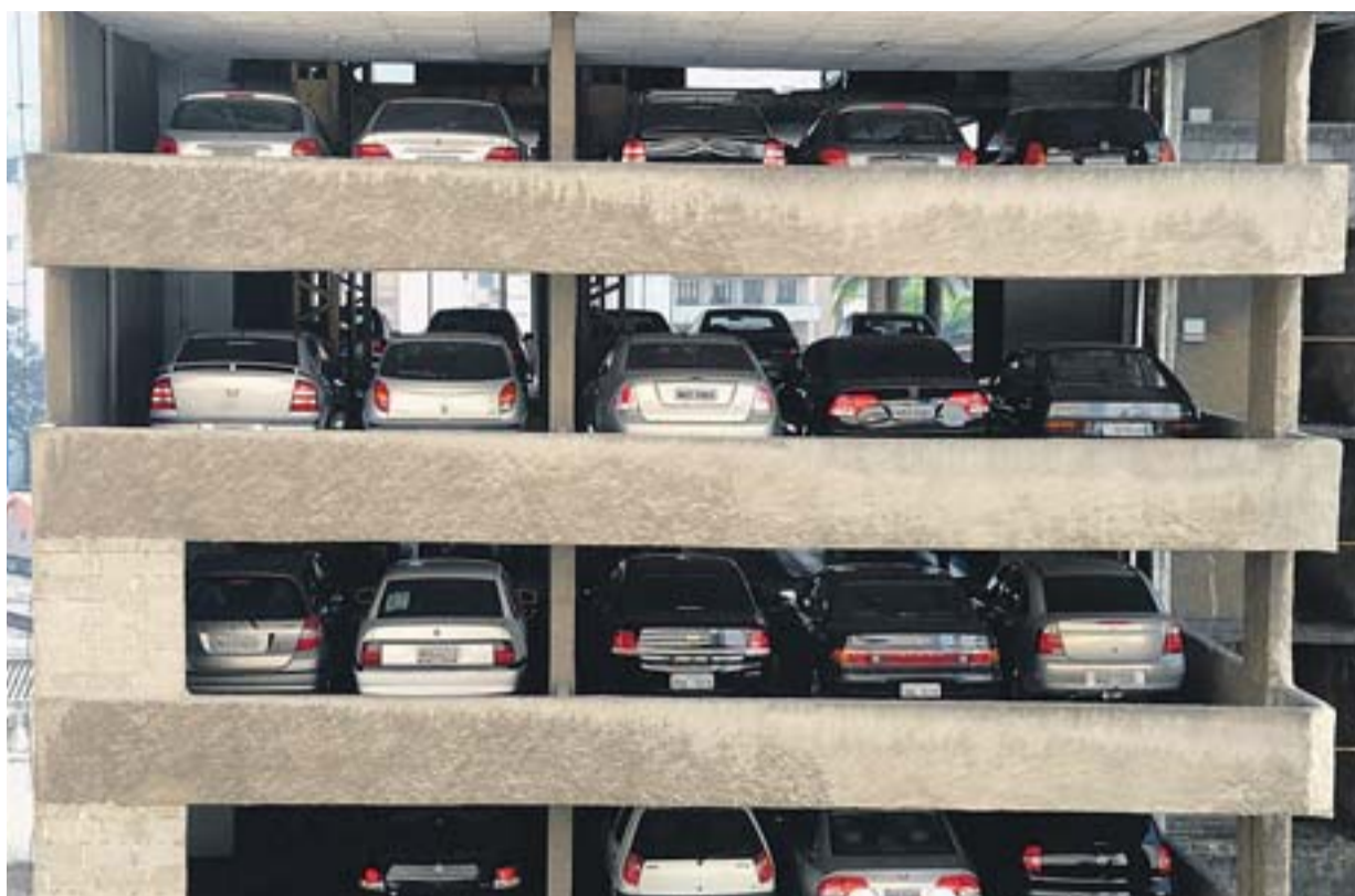
MODELO DE EDIFÍCIO-GARAGEM: Prefeitura estuda instalação de novas opções de estacionamento