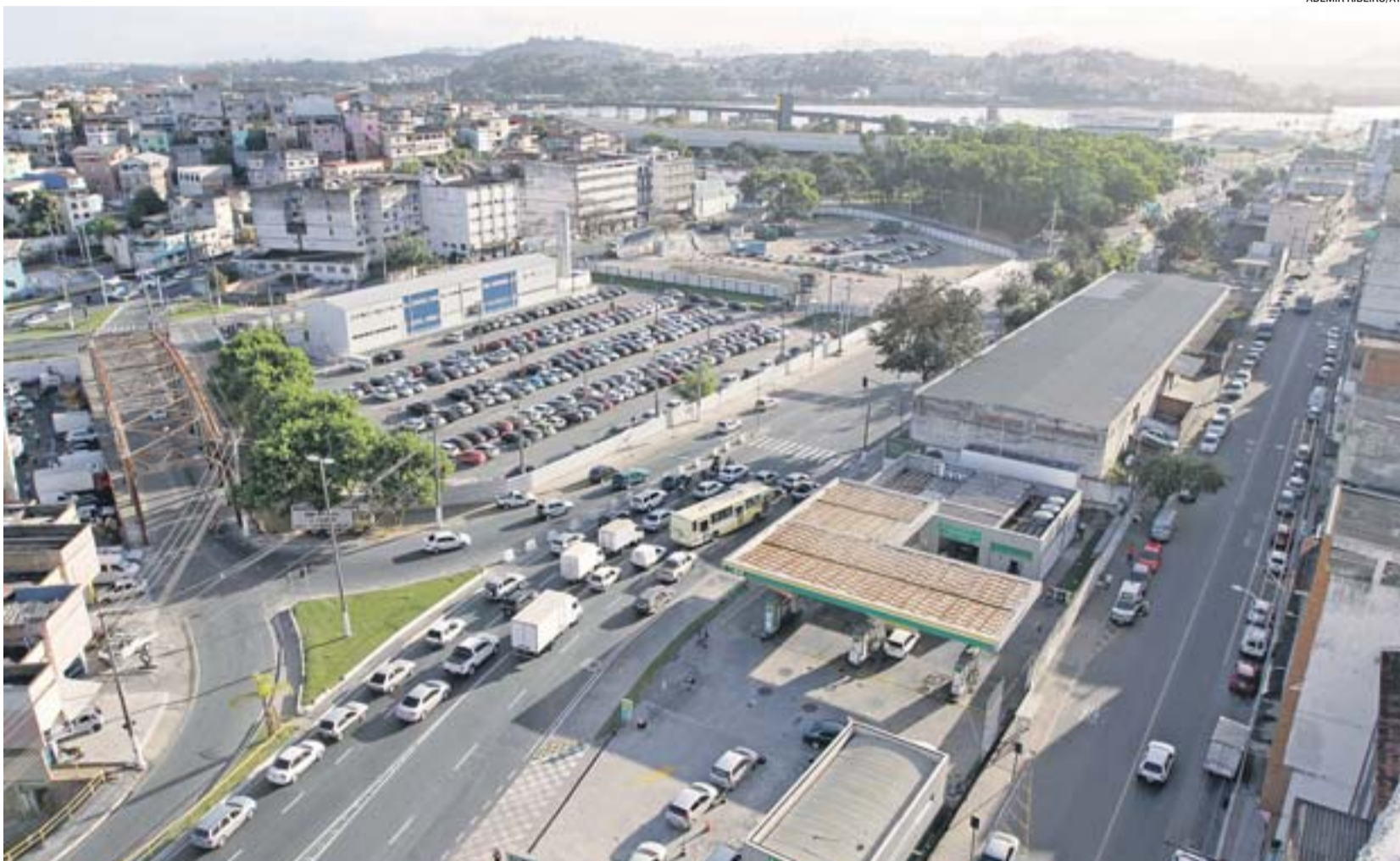
VISTA GERAL DA REGIÃO DA ILHA DO PRÍNCIPE, que será transformada. Previsão é que algumas obras sejam licitadas até o final do mês que vem

Segundo ele, a prefeitura e o governo do Estado estão trabalhando num projeto arquitetônico para revitalizar a região e aumentar o fluxo de pessoas, o comércio e o turismo na região.