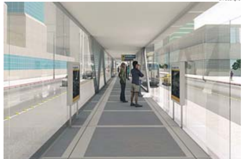
PROJETO prevê como será estação de embarque e desembarque do BRT