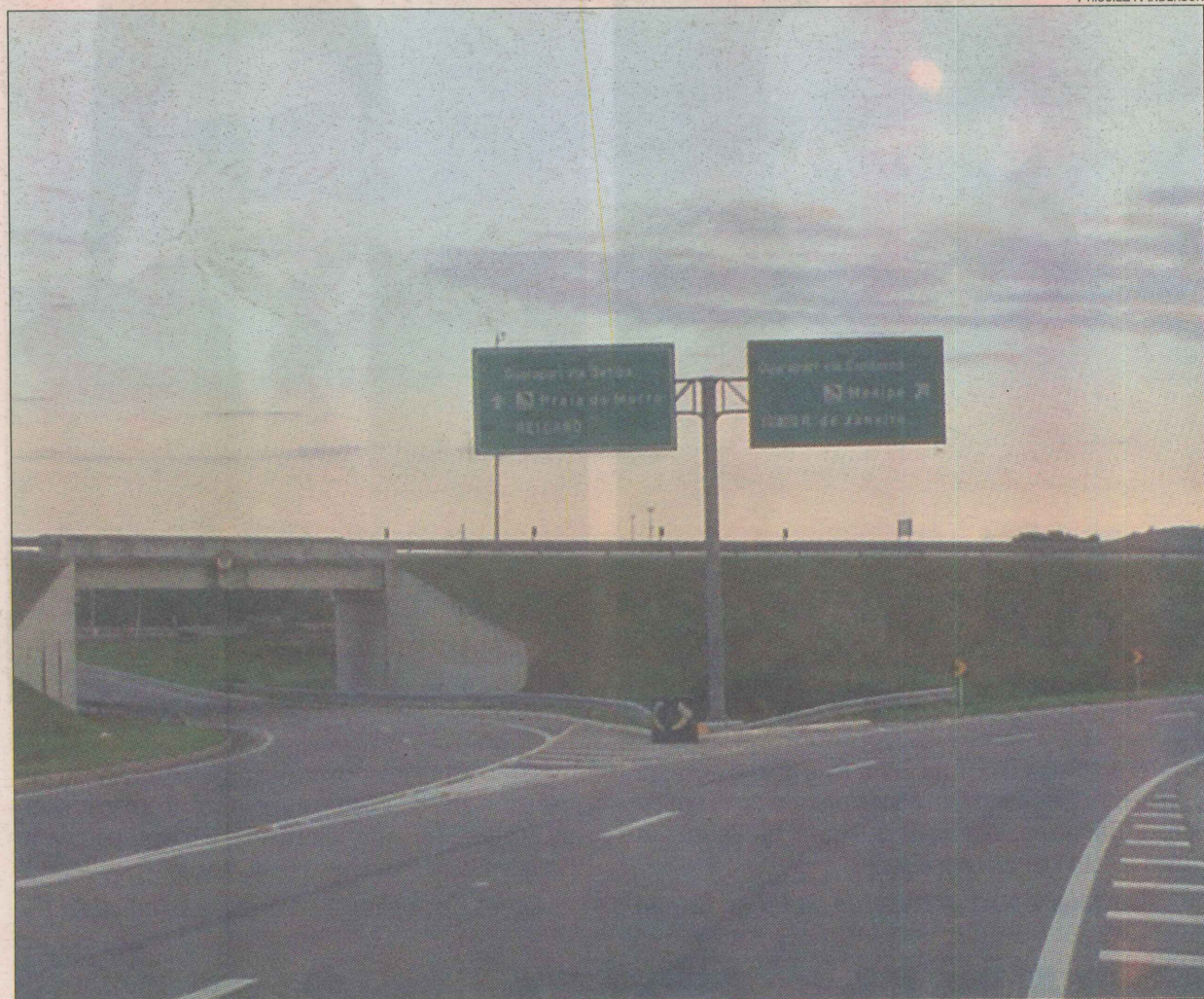
O governo estadual quer preparar a rodovia para a nova fase de crescimento na região