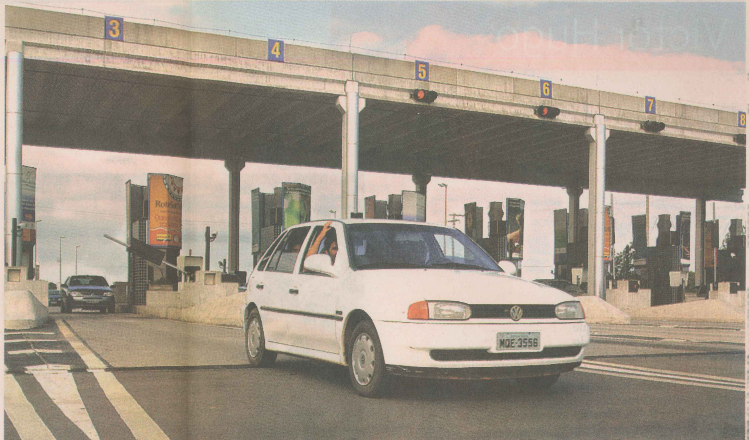
FLUXO. Diariamente, 5,1 mil automóveis passam pelo pedágio da rodovia, segundo a Rodosol.

A empresa que fará a instalação do sistema já foi contratada. "Esperamos concluir o mais breve possível essa instalação para que possamos contar com dados capazes de serem confrontados com os fornecidos pela concessionária", disse.