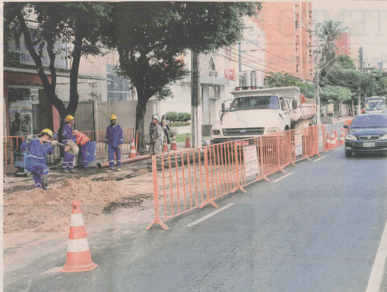
OPERÁRIOS trabalham em sistema na Reta da Penha: mais 6 mil imóveis vão ser ligados à rede de esgoto

4 milhões de litros de esgoto serão tratados por dia