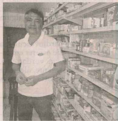
DELMI: tem farmácia há 16 anos