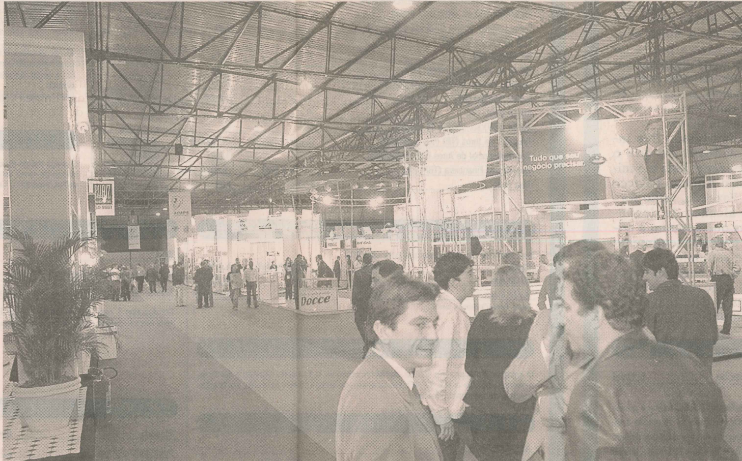
OTIMISMO. Movimento na Feira da Acaps: setor supermercadista vive um bom momento.

“Tem loja que voltou a utilizar a velha caderneta e a tão conhecida nota promissória”, conta o presidente da Acaps. A utilização da caderneta, onde são anotadas as compras de cada cliente é uma estratégia para fugir do cartão de crédito e dos cheques sem fundos.