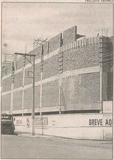
Filial da rede Casagrande

Um empreendimento em São Mateus ou Colatina também não está descartado, segundo ele.