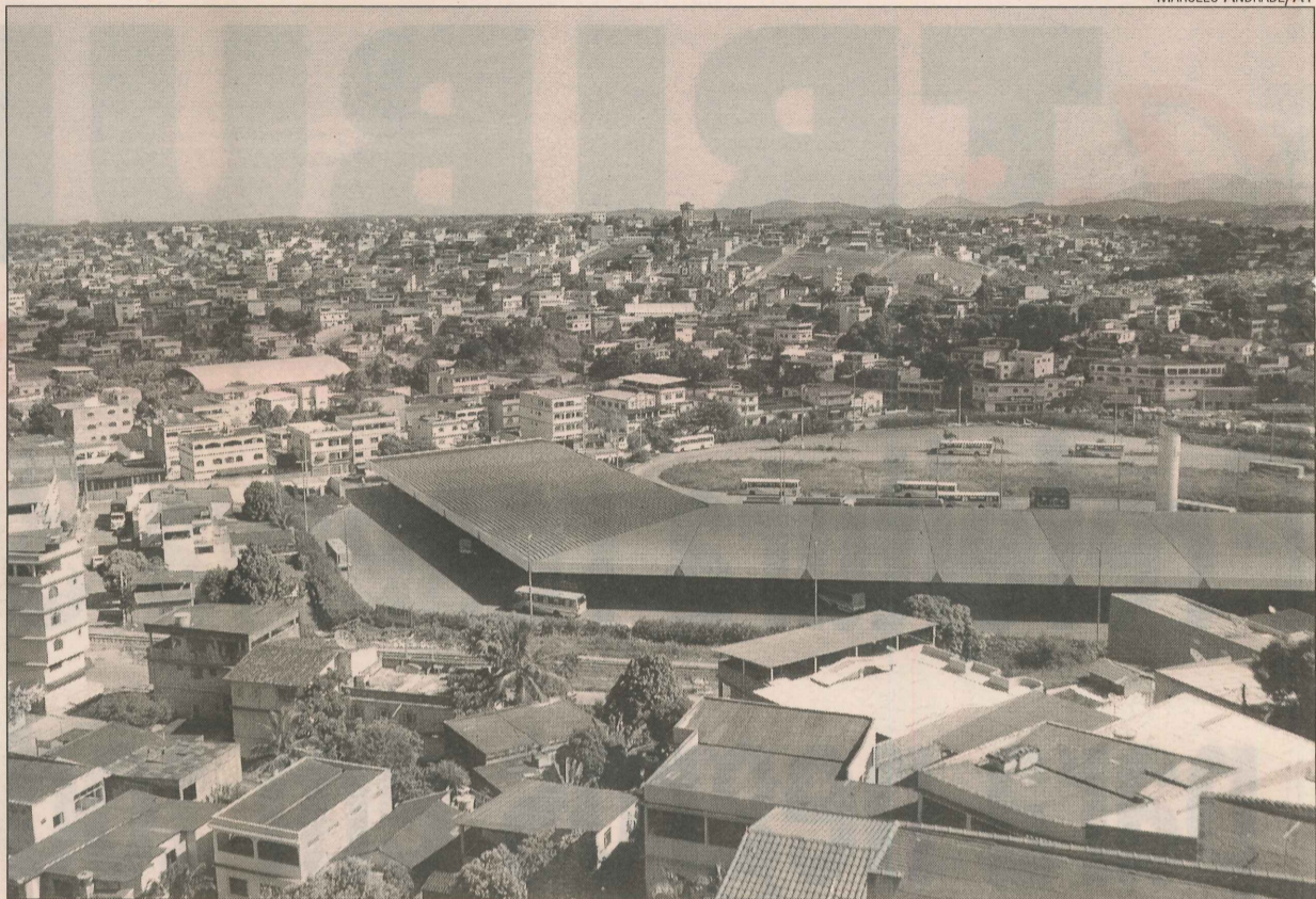
Terminal de Campo Grande, de onde vão começar as obras da futura rodovia

"Só nessa primeira fase, 15 mil passageiros serão atendidos por dia. As viagens de Cariacica e Viana para Vila Velha serão mais rápidas. Com a inauguração do Terminal de Itaparica, vamos retirar metade das linhas que, hoje, vão para o Terminal de Vila Velha", disse Denise.