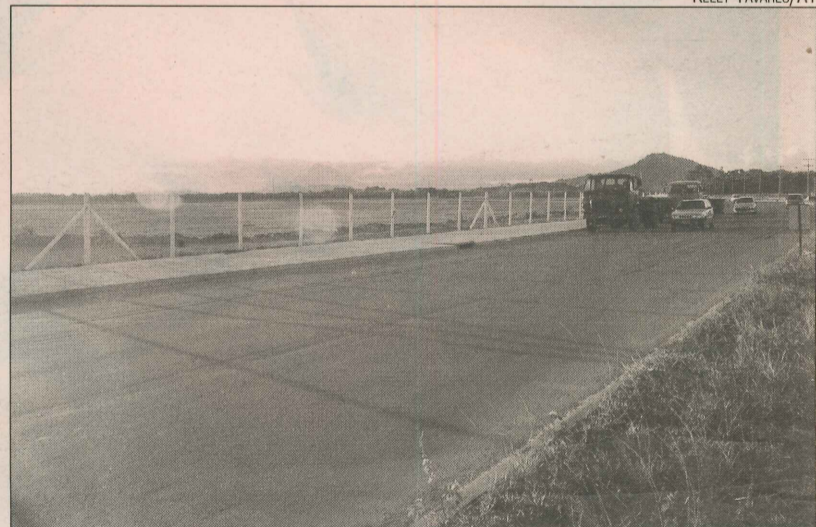
Darly Santos vai ganhar acostamento, ciclovias e passeios