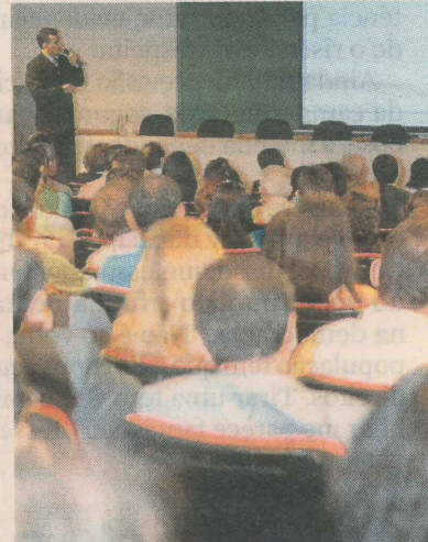
AUDIÊNCIA para definir obras