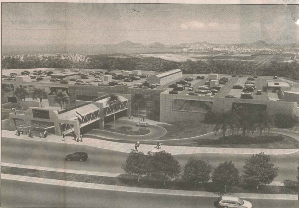
Projeto do Shopping Mestre Álvaro, na Serra, que terá 80 mil metros quadrados

O shopping também vai ter um centro médico com 84 salas. A praça de alimentação terá 23 lojas e vista panorâmica.