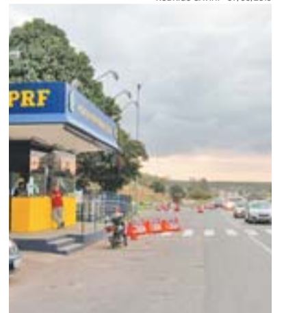
POSTO DA PRF: obras na região